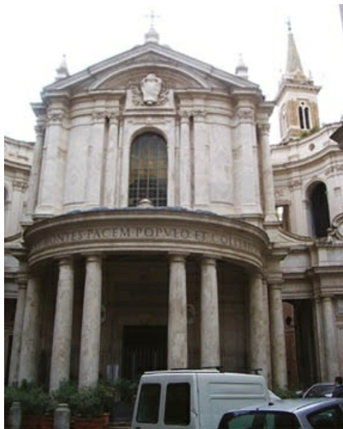
Pietro da Cortona. Fachada de Santa Maria della Pace, en Roma. Su planta baja está configurada como un pórtico semicircular convexo que sobresale hacia el espacio urbano.

En 1655 comenzó la fachada de Santa Maria della Pace, encuadrada en el conjunto urbanístico de la plaza donde se ubica. Su planta baja está configurada como un pórtico semicircular convexo que sobresale hacia el espacio urbano.