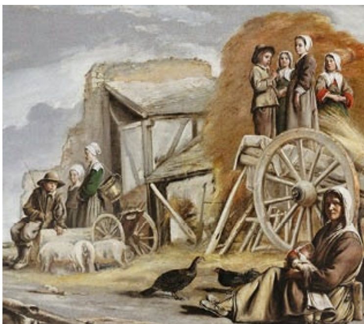
La carreta de Louis le Nain (1641), en el Museo del Louvre. La instantaneidad y el dominio del espacio, junto con los efectos lumínicos, caracterizan estas obras, que presentaban la vida campesina de un modo idílico.

Antoine cultiva escenas campestres, puramente paisajísticas, sin ningún afán didáctico o moralizante. Se ha querido apreciar en él cierta influencia veneciana.