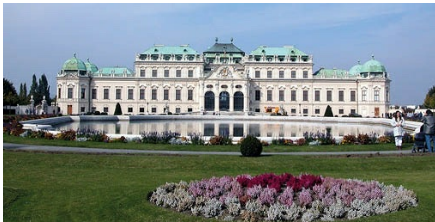
Lucas von Hildebrandt. Palacio de Belvedere (Viena), formado por siete cuerpos diferentes con cubierta de faldón, encuadrados en cada extremo por sendas torres cubiertas con cúpula.

Johann Lucas von Hildebrandt (1668-1745), italiano de nacimiento, se formó en el estudio-taller de Carlo Fontana y sintió admiración por los arquitectos más innovadores de su tierra: Borromini y Guarini. Llevó a cabo obras de gran monumentalidad con efectos ilusionistas, entre las que destacan la reconstrucción del antiguo palacio Mirabell (del italiano mirabile : ‘admirable’) de Salzburgo (1706), con sus hermosos jardines, el palacio Daun-Kinsky (1713-1716), en el que prima su caprichosa portada coronada con frontón curvo partido entre dos atlantes que sostienen el entablamento, y el palacio de Belvedere en Viena. Este, realizado entre 1721 y 1722, está formado por siete cuerpos distintos, todos con cubierta de faldón, entre los que sobresale el central flanqueado por otros dos de menor altura a los que escoltan a cada lado sendos pabellones más bajos; el conjunto está encuadrado en cada extremo por una torre cubierta con cúpula. Diferentes adornos (grutescos y espirales) salpican muros y ventanas, adornadas con molduras caprichosas; estatuas y trofeos lucen coronando y rematando los tejados. En cuanto a los interiores, son características de este arquitecto las salas octogonales u ovaladas y las monumentales escaleras.