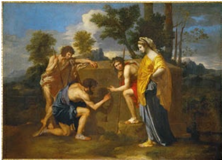
Los pastores de la Arcadia o Et in Arcadia ego ('También yo en la Arcadia'), de Poussin (1639), en el Museo del Louvre. Cuadro inspirado en otro del Guercino sobre el mismo tema.

En 1637, con fama ya internacional, el rey de España, Felipe IV, le encarga grandes cuadros de santos penitentes para el Real Alcázar de Madrid. Poussin pinta San Jerónimo , que se aleja un tanto de lo veneciano y muestra rasgos prerrománticos en el paisaje.