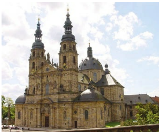
Catedral de Cristo Salvador en Fulda (Alemania). Adosadas a sus torres de cuatro cuerpos, coronadas por capiteles bulboides hay sendas capillas abovedadas.

En la Alta Baviera trabajaron los Dientzenhofer, una familia de arquitectos que a lo largo de varias generaciones llevó a cabo la construcción de numerosas iglesias por toda Bohemia, Franconia y el Alto Palatinado. Entre las primeras, aún a finales del siglo XVII, se halla la de peregrinación de Kappel, cuya planta trilobulada simboliza la Santísima Trinidad a la que está consagrada, mientras sus cúpulas bulboides le dan un aire oriental.