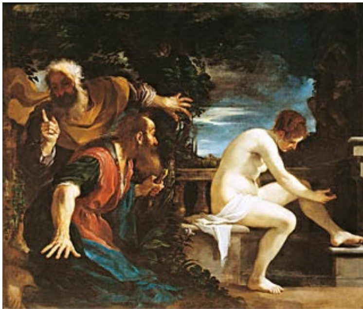
Susana y los viejos , de El Guercino (1617), Museo del Prado. La teatralidad alcanza a un tercer voyeurista (¿el espectador?) fuera del lienzo. Gestos contrapuestos, como en la técnica: caravaggiesca en la penumbra y clasicista en el bello cuerpo de la joven.

Guido Reni (1575-1642), que fue alumno de los Carracci y comenzó siendo un pintor academicista, a veces ecléctico, viajó a Roma y adquirió algunas influencias caravaggiescas con las que pintó diversas obras dentro de esta tendencia. Después, tomó partido por una línea clásica en un estilo no exento de convencionalismos, como se aprecia en alguna de sus obras mitológicas: Hipómenes y Atalanta .