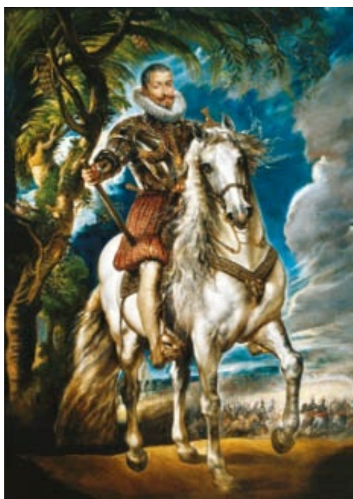
Retrato ecuestre del duque de Lerma (valido de Felipe III), pintado por Rubens en 1603. Se encuentra en el Museo del Prado.

Ese mismo año, habiendo fracasado todos los intentos de conversión de los moriscos —descendientes de los musulmanes hispanos— se decidió su expulsión de España, como si esta no fuera su propia tierra que les vio nacer, primero del reino de Valencia, donde eran más numerosos, y al año siguiente de Castilla, Aragón y Cataluña, acusados de tener relaciones con los piratas turcos y berberiscos, hermanos de religión. Para muchos nobles representó una ruina económica, pues les necesitaban como mano de obra, especialmente en el campo, donde eran muy primorosos con las faenas agrícolas, e intentaron oponerse a tan radical medida, pero fue en vano. La patria les echó al mar con solo tres días de plazo para abandonar sus hogares: 150 000 valencianos, 65 000 aragoneses, 40 000 andaluces... unos 300 000 españoles hubieron de buscar, no sin luchas y revueltas inútiles, otro cielo que les cobijase.