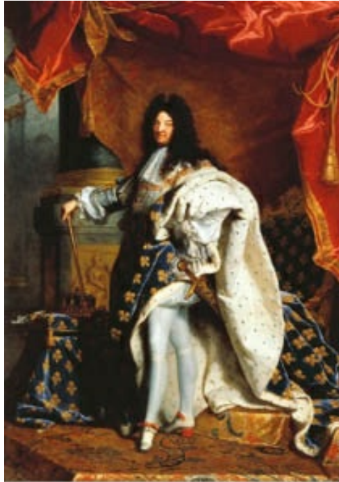
Luis XIV, por Rigaud. Museo del Louvre. Desde un punto de vista bajo, la solemnidad de la pose, ataviado con el manto de flores de lis y los atributos de poder (la espada y el cetro) manifiestan el absolutismo monárquico del Rey Sol.