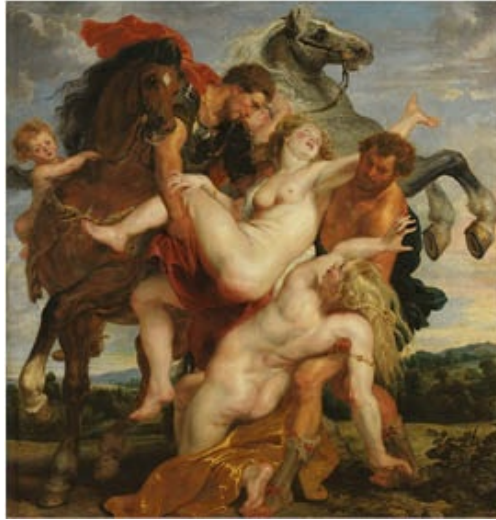
Rabto de las hijas de Leucipo de Rubens (1616-1618), en la Pinacoteca Antigua de Múnich. La diagonal, los fuertes escorzos, el dinamismo, la teatralidad, el colorido exuberante rezuman barroco por todas partes.

Ya hombre maduro, se casa con Elena Fourment, una muchacha de dieciséis años. Su pintura se torna vitalista, alegre, sensual. Vuelve a las escenas mitológicas, a los matices eróticos, vitales. Copia cuadros de Tiziano, bacanales, llenos de colorido y movimiento. Pinta Las tres gracias , en las que retrata a sus dos esposas: a la derecha, morena, Isabel; a la izquierda, rubia, Elena, a quien realiza también varios retratos, sola y con sus hijos.