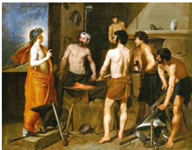
La fragua de Vulcano de Velázquez (1630), en el Museo de Prado. Se nota el aprendizaje de los pintores italianos de manera directa en el interés por los desnudos o en el tratamiento destacado del dios Apolo.