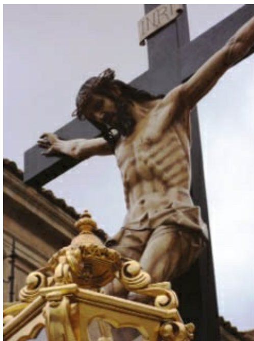
Copia del Cristo de los Valderas obra de Gregorio Fernández, que se guarda en la leonesa iglesia de San Marcelo. El extraordinario estudio anatómico denota la gubia del gran tallista gallego, que labró la obra en 1628.

A partir de 1630-1631 se da su última fase, en la que aumentan, si cabe, el dramatismo, la dureza de los paños y las actitudes teatrales, como se aprecia en el Cristo de la Luz de Valladolid y en el San Miguel de Alfaro (La Rioja), o en los expresivos rostros de San Marcelo y San Antonio Abad de León, el primero en la iglesia de su nombre y el segundo perteneciente al antiguo hospital de San Antonio Abad y localizado en el retablo de la capilla del hospital moderno por F. Llamazares y J. Rivera, en 1977.