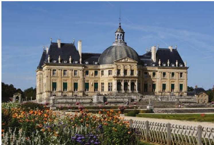
Luis Le Vau. Palacio de Vaux-le-Vicomte. Domina la idea de la grandiosidad monumental, visible en su enorme cúpula ovalada. Su diseño responde al tipo entre cour et jardin , es decir, entre patio y jardín.

Su obra maestra fue el palacio de Maisons-Lafitte, construido para el acaudalado René de Longueil entre 1642 y 1646. Consta de planta rectangular y dos alas salientes, centrado por un hastial donde se abre la entrada principal, coronada por frontón triangular partido.