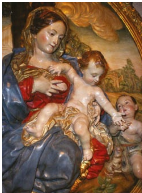
Virgen de la Leche de Francisco Salzillo. Se encuentra en la catedral de Murcia. Con la gracia prerrococó, prolonga la teatralidad del barroco español hasta bien entrado el siglo XVIII.

Destacan los pasos procesionales, principalmente en grupo: la Última Cena , la Oración en el Huerto , el Prendimiento , Cristo a la columna , la Caída , la Verónica .