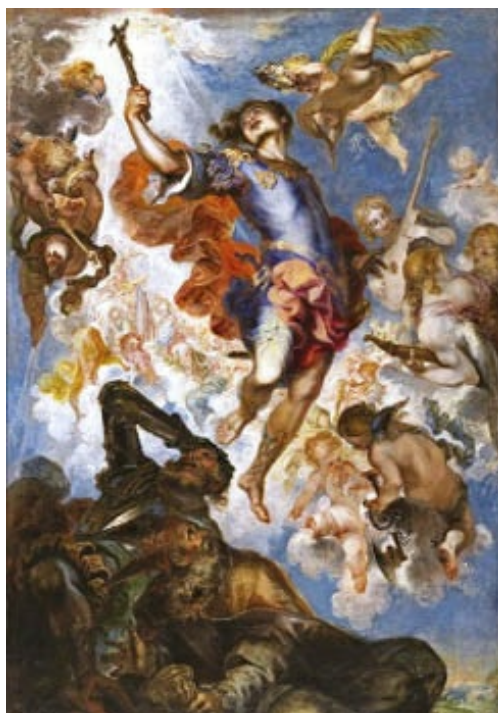
Triunfo de san Hermenegildo de Francisco de Herrera el Mozo (1654) en el Museo del Prado. La composición helicoidal ascendente, cual columna salomónica, y el estilo dinámico muestra todo el efectismo y la teatralidad escenográfica de la pintura barroca.

Francisco Herrera, llamado el Viejo (c. 1590-1656), representó un papel muy importante en la transición de la pintura manierista al barroquismo del siglo XVII. Hay autores que le consideran como uno de los pintores que tuvo repercusión en la formación de Velázquez, mientras otros afirman que este se hallaba, en sus inicios, muy vinculado al realismo caravaggiesco, por lo que la pintura manierista del primer Herrera tendría poco que ver con él.