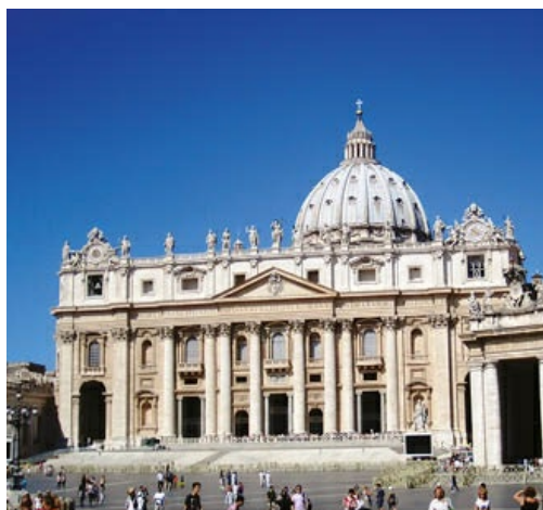
Fachada de la basílica de San Pedro del Vaticano, obra de Carlo Maderna. Toda la estructura se supedita a la logia central del pórtico, lugar destinado a la bendición papal.

Su obra más popular es la fachada de San Pedro del Vaticano, de la que se encargó entre 1606 y 1619 tras haber obtenido del papa Clemente VIII el nombramiento de arquitecto de San Pedro en el año 1603.