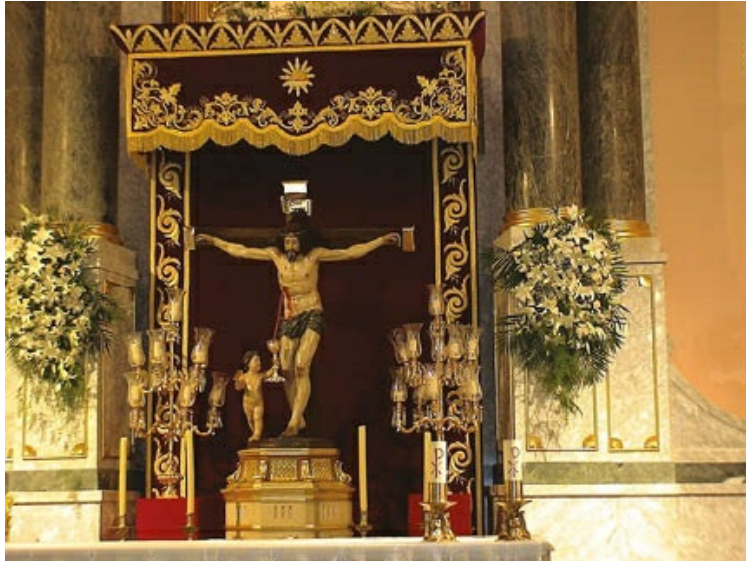
Santísimo Cristo de la Sangre , iglesia parroquial de Nuestra Señora del Carmen (Murcia), por Nicolás de Bussy. De las llagas del Crucificado brota la divina sangre que un ángel recoge en el cáliz, como el mítico santo grial.

anuncian el estilo rococó, como se observa, por ejemplo, en su imagen de la Virgen Peregrina —una de las escasas que existen— del tipo pabellón (solamente tiene trabajados el rostro y las manos, así como la escultura del Niño) para el antiguo santuario del mismo nombre en Sahagún (León).