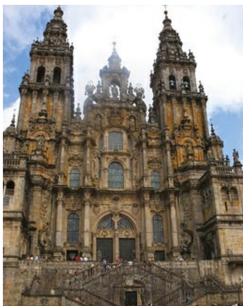
Monumental fachada del Obradoiro en la catedral de Santiago de Compostela, obra cumbre de Casas Novoa. Los órdenes de columnas superpuestas y el escalonamiento de las torres proporcionan verticalidad.

En la catedral de Lugo dirigió desde 1712 el claustro catedralicio, iniciado por fray Gabriel Casas en 1709. De planta rectangular, consta de un solo piso formado por cinco grandes arcadas en cada lado separadas por dobles pilastras toscanas. Construyó también la capilla de Nuestra Señora de los Ojos Grandes (1726-1736), en novedosa planta de cruz griega potenziada, con sus cuatro brazos cubiertos con bóvedas de cascarón gallonadas y cúpula semiesférica con linterna en el crucero, apoya sus doce nervios sobre la cornisa volada.