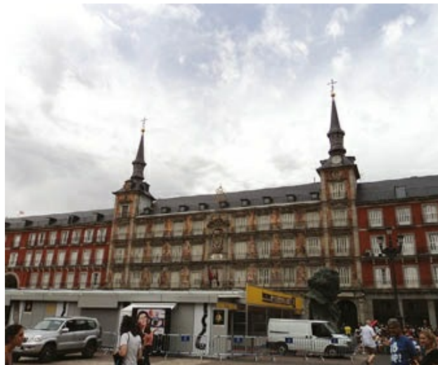
Casa de la Panadería, en el lado norte de la plaza Mayor de Madrid. Contruida por Juan Gómez de la Mora y diseñada en 1590 por Diego Sillero para el gremio del pan (de ahí el nombre).

Su formación se inscribe en el círculo escorialense, de la mano de su citado tío, Francisco de Mora, discípulo de Juan de Herrera. Así se observa en sus fachadas lisas, en las que solamente al final de su vida se aprecia el mayor influjo barroquizante en cuanto a motivos ornamentales, como en el antiguo ayuntamiento de Madrid, obra que comenzó en 1640 y remodelaría posteriormente Carbonell.