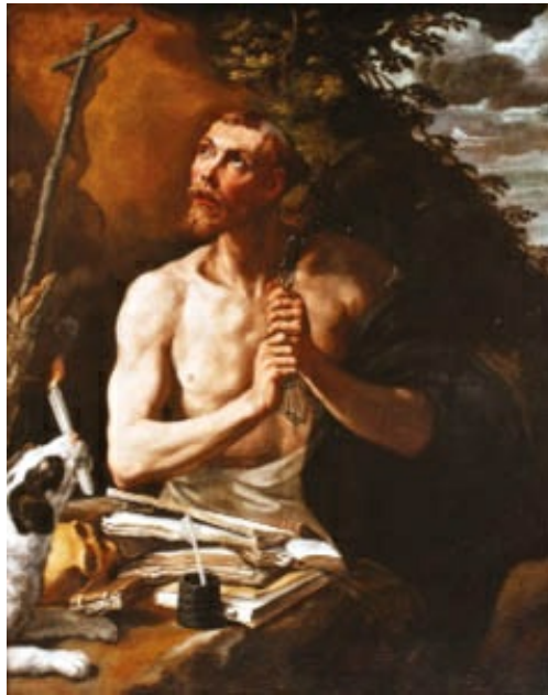
Santo Domingo penitente de Luis Tristán en el Museo de El Greco (Toledo). Destacan los contrastes lumínicos y los tonos cálidos de raíz tenebrista, así como la presencia de naturalezas muertas: calavera, libros, papeles, tintero.

Escorial. En su paleta predominan los tonos terrosos, con una conseguida luminosidad. Aparte de algunos retratos de acusado realismo como El anciano y El cardenal , pintó obras religiosas: La Adoración de los Magos (muy luminosa), Santo Domingo penitente (de aire tenebrista). Cultivó también con gran acierto los bodegones.