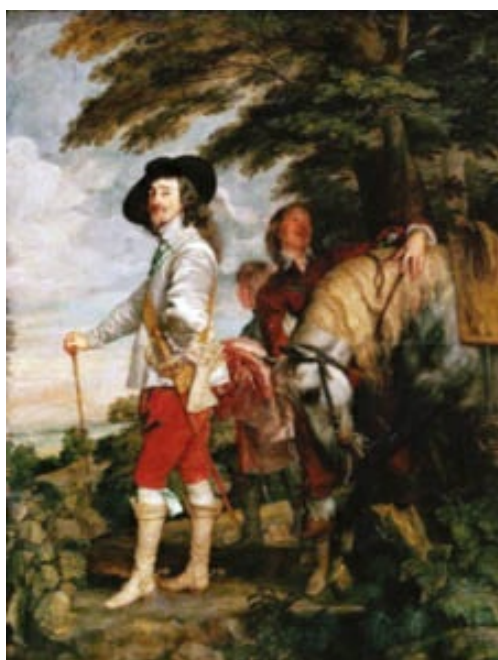
El rey Carlos I de Inglaterra retratado con la habitual elegancia y dominio de la composición por Van Dyck (h. 1635). Museo del Louvre.

Entre sus principales medidas estuvo la publicación de las Actas de Navegación, en 1651, que estipulaban que el comercio con Inglaterra solo podía ser ejercido por barcos ingleses o de aquellos países que mantuvieran acuerdos comerciales con Inglaterra, con el fin de enfrentarse a su competidora, Holanda.