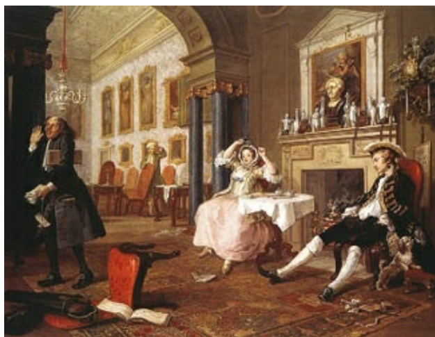
Poco después de la boda (escena 2.ª) de William Hogart (1743), en la National Gallery de Londres. Una escena popular, costumbrista, con afán satírico o moralizante.

Sir Joshua Reynolds (1723-1792) se caracteriza por un aire elegante y aristocrático, además de dominar también el tratamiento del paisaje. Pintó retratos de personajes importantes de su época, como el del Duque de Devonshire o el de Lord Heathfield . En el estilo elegante sigue a Van Dyck y exhibe una gran viveza de colorido.