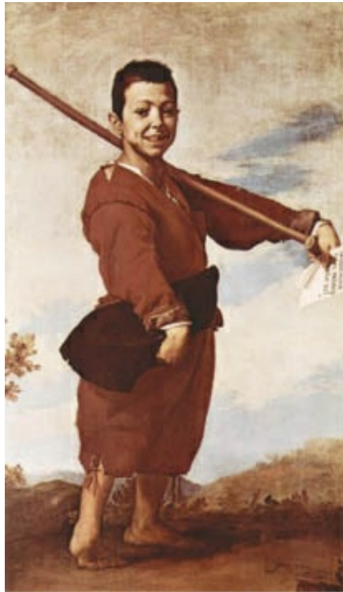
El patizambo de José de Ribera (1642) en el Museo del Louvre. La cruda realidad aflora en un niño hemipléjico que también padece afasia (sin lenguaje) y tiene que mostrar un papel escrito para pedir limosna. El paisaje y el fondo claro de la segunda etapa del pintor acompañan la ingenua sonrisa del lisiado.

destacando, especialmente en el primero, algunos detalles originales como la indiferencia que se aprecia en los martirizadores mientras causan el máximo dolor al santo. Esa maestría y esplendor en el uso del color se manifiesta especialmente en la Inmaculada (1636) del retablo mayor de la iglesia del convento de las Agustinas de Monterrey, en Salamanca.