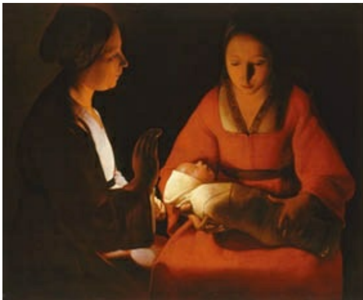
Recién nacido de Georges de La Tour, expuesto en el Museo de Bellas Artes de Rennes. En una atmósfera de silencio, misterio y meditación, es la luz, como en Caravaggio, la que enfatiza los volúmenes.

La pintura del Grand Siècle abarca varias tendencias, quizá porque el arte del país galo estuvo durante este período vacilando entre continuar en su clasicismo particular o apuntarse a las nuevas corrientes artificiosas que venían de Italia. La primera de dichas tendencias, que inaugura el Barroco francés en pintura, es la de los seguidores de Caravaggio, conocidos como tenebristas.