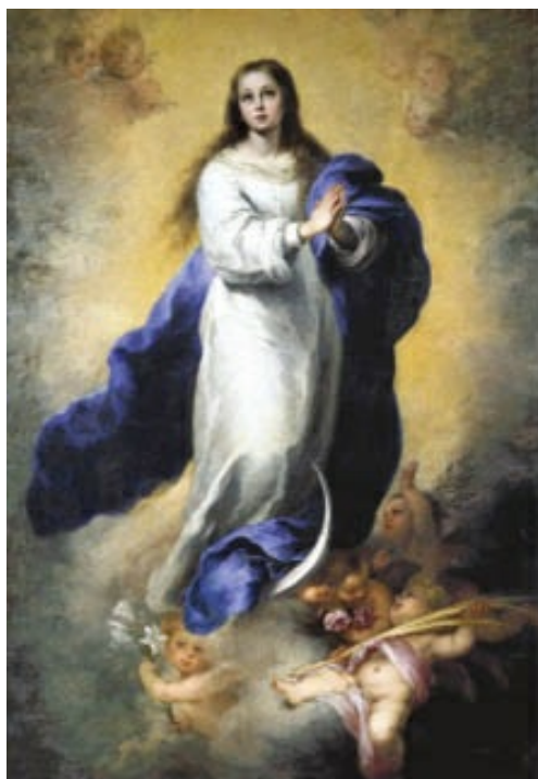
La Inmaculada de El Escorial de Bartolomé Esteban Murillo (h. 1665) en el Museo del Prado. Se llama así por haber estado en el real sitio. Perfección y pureza mariana para despertar el fervor popular que perseguía el espíritu de la Contrarreforma.

En su faceta de pintura profana hay que destacar el gusto por temas de la infancia, al principio escenas tristes y miserables, pero poco a poco van tomando un aire alegre e incluso picaresco, en consonancia con este género de novela muy en boga en la época: El Lazarillo , El Buscón , El Guzmán de Alfarache . Así, unos Niños comiendo melón dejan ya de dar pena por sus harapos porque están representando un hecho simpático que despierta la gracia a causa de su espontaneidad, temas que ya en su tiempo gozaron de gran aceptación, especialmente entre los comerciantes nórdicos, en cuyos países abundaban las escenas de género, lo que explica su ausencia en los museos españoles.