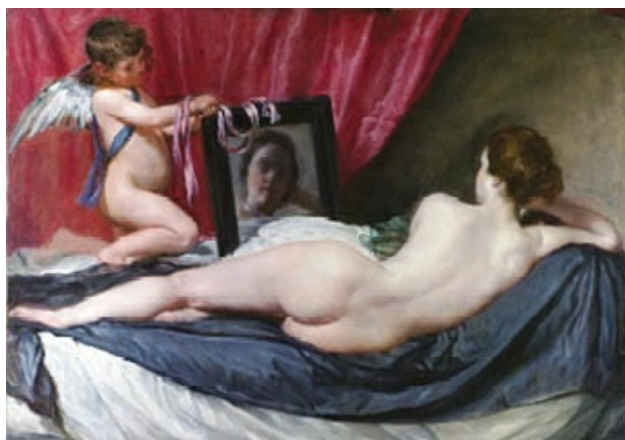
La Venus del espejo de Velázquez (h. 1648), en la National Gallery (Londres). Único desnudo conservado de la casta pintura velazqueña, cargado de erotismo en la sensual postura de la diosa y el rojo cortinaje del fondo.

Se duda sobre si La Venus del espejo —con el novedoso recurso de mostrar el rostro de la diosa dentro del marco del objeto que da nombre al cuadro—, único desnudo conservado de la casta pintura velazqueña, fue realizada en Italia o de regreso en Madrid.