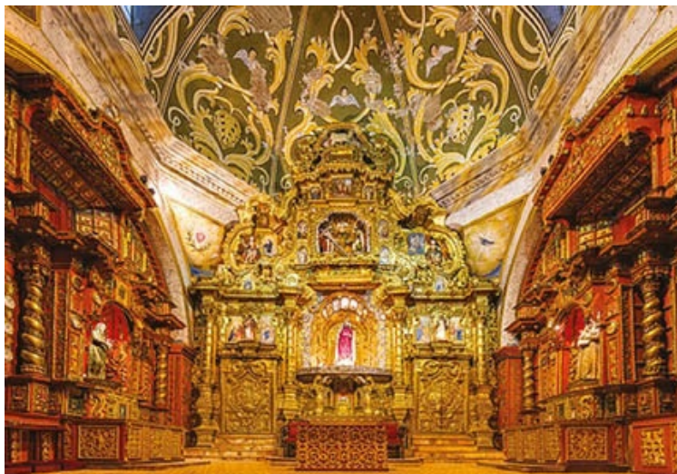
Churrigueresca capilla de la Virgen del Rosario (siglo XVIII) en la iglesia de Santo Domingo de Quito, repleta de fastuosa decoración en oro

En pintura ejercieron gran influencia Zurbarán y Murillo así como Valdés Leal en el mexicano Juan Rodríguez Juárez y en el colombiano Gregorio Vázquez de Arce.