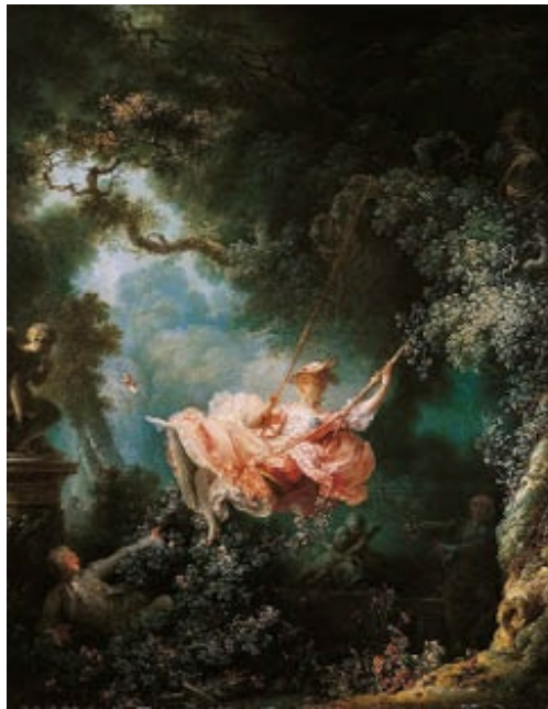
El columpio de Jean-Honoré Fragonard (1767), en la Wallas Colection de Londres. La vegetación se adueña de la escena y llega a prender hasta en las vestimentas del personaje femenino entre la picardía de los protagonistas.

Jean-Honoré Fragonard (1732-1806) destacó por ser uno de los pintores que en varias de sus obras preludian la época romántica, con un estilo vivo y colorista, a pesar de hallarse aún en pleno siglo XVIII. Estuvo en Roma, junto con el también pintor Hubert Robert, y quedó embebido de ardoroso romanticismo observando las fuentes, jardines y estatuas de la Ciudad Eterna.