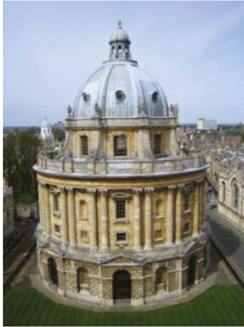
Radcliff Camera (biblioteca de la Universidad de Oxford) de planta circular sobre un zócalo también curvo, coronada por una gran cúpula semiesférica con linterna sobre tambor circular.

Para la biblioteca de la Universidad de Oxford, la Radcliff Camera, diseñó una planta circular dispuesta sobre un zócalo también curvo, coronada por una gran cúpula semiesférica sobre tambor circular y rematada por una linterna a juego con la cubierta de pizarra. Articulan el exterior dobles columnas adosadas, entre las que alternan ventanas bajo frontón triangular y huecos en forma de hornacina destinados, seguramente, a albergar estatuas.