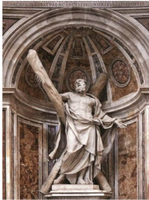
Santa Susana en la iglesia de Santa María de Loreto de Roma y San Andrés en San Pedro del Vaticano, por François Duquesnoy entre 1629-1633; la primera en sereno contraposto y la segunda en dramatismo atenuado.