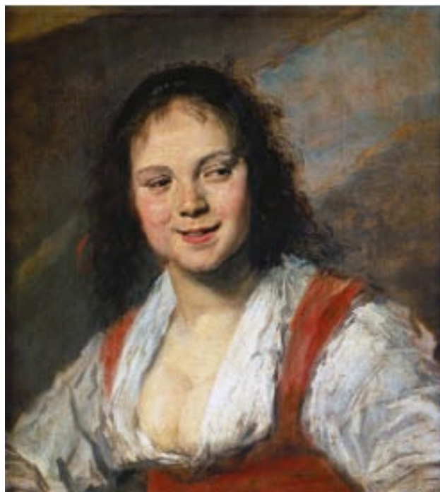
La gitanilla de Franz Hals (1630), en el Museo del Louvre. Buen captador de tipos populares con pincelada pequeña y rápida, que da a su pintura un aire alegre, y hace gala del detallismo y el colorido típico de su tierra.

Rembrandt representó la cumbre del retrato colectivo —rompe con las reglas del retrato oficial—, género en el que realizó tres grandes cuadros: Lección de anatomía (1632) —donde se muestra como un buen conocedor del iluminismo caravaggiesco—, Ronda Nocturna (1642) —con los personajes en movimiento en lugar de estáticos, posando, algo que no gustó a quienes la habían encargado— y Los síndicos del gremio de pañeros (1662), donde su agudo sentido pictórico hace gala de un gran realismo.