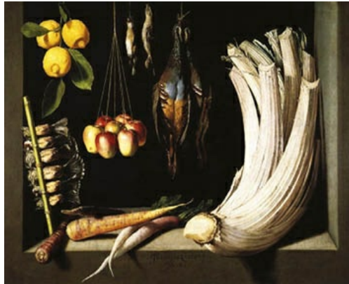
Bodegón de caza, hortalizas y frutas , de Sánchez Cotán (1602), en el Museo del Prado. La luz crea los volúmenes; la técnica del trampantojo acerca los objetos al espectador introduciéndolo en el cuadro y rompiendo la diferencia entre espacio real y ficticio.

Así, surgen en Toledo, curiosamente feudo de El Greco, los primeros pintores de la nueva tendencia, como Juan Sánchez Cotán (1560-1627), que además de sus cuadros sobre tema religioso destacó en las pinturas de bodegón, en las que exhibió sus buenas dotes de tenebrista y claroscuroista disponiendo los alimentos sobre una alacena con fondos negros donde la luz modela y crea los volúmenes; la técnica del trampantojo hace avanzar los objetos hacia el espectador introduciéndolo en el cuadro y rompiendo la diferencia entre espacio real y ficticio: Bodegón de caza, hortalizas y frutas (1602, Museo del Prado), Bodegón del cardo (1603, Museo de Bellas Artes de Granada).