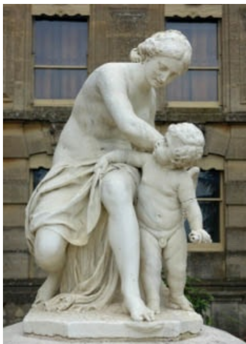
Venus armando a Cupido , en los jardines de Waddesdon Manor (Buckinghamshire, Inglaterra), típica escultura mitológica de Jean-Baptiste Pigalle

Otro de los escultores que trabajaban para la corte de Versalles a base de encargos oficiales fue Jean-Louis Lemoyne (1665-1755), que destacó por su habilidad en el arte del retrato, como se aprecia en los bustos de Hardouin-Mansart y Montesquieu.