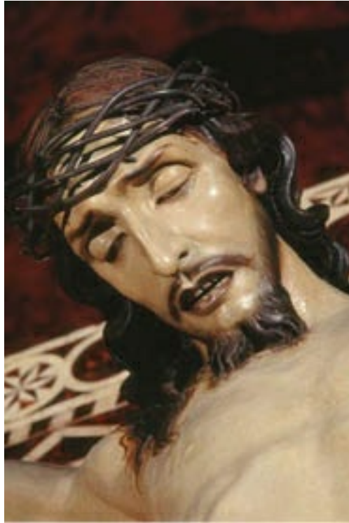
Santísimo Cristo de la Misericordia de José de Mora, en la iglesia parroquial de San José del Albaicín (Granada). Muestra del patetismo que maneja este escultor.

Dolorosa de la capilla real se acerca más al Ecce Homo de Mora. Como imagen de vestir tiene la Esperanza de Santa Ana .