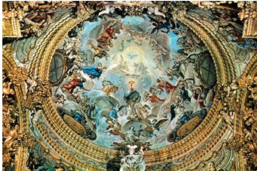
Cúpula del Sagrario de la Cartuja de Granada, pintada al fresco por Palomino y Risueño. Rompe la Gloria con la Trinidad, María y san Juan Bautista, mientras san Bruno, ayudado por la Fe, sostiene la bola del mundo coronada por la Hostia.