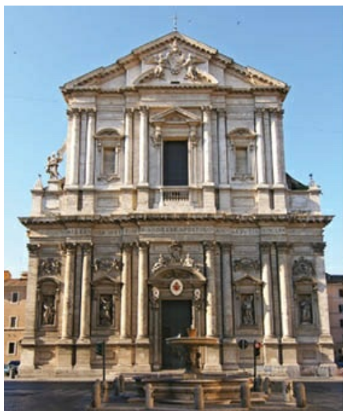
Rainaldi. Fachada de San Andrés del Valle de Roma sobre diseño original de Carlo Maderno. Bajo el frontón que la remata, presenta dos cuerpos con columnas corintias pareadas entre las que se abren hornacinas que albergan las estatuas.

Carlo Rainaldi (1611-1691), que se formó en el taller de su padre, el también arquitecto Girolamo Rainaldi, comenzó a trabajar en la iglesia de Santa Agnese (Santa Inés en agonía) en plaza Navona, la capilla de la familia del papa Inocencio X. En 1653 Borromini se hizo cargo de las obras; pero en 1657 cayó en desgracia y Rainaldi volvió a ser requerido para finalizar el templo y, añadiendo un cuerpo a cada una de las torres, que alcanzan la altura de la cúpula y enturbian su monumentalidad, modificó el proyecto de su antecesor, que a su vez había derribado y rehecho en forma cóncava la fachada construida por su padre y por él.