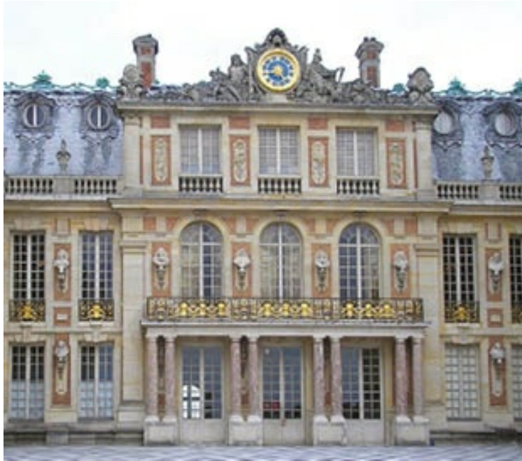
Versalles. Detalle de la fachada al patio del palacio.

amorcillos tallados por Coysevox, asientos tapizados de terciopelo escarlata bordado con hilos de oro..., todo bajo la espléndida bóveda decorada con pinturas y relieves por la mano de Charles Le Brun, que adoptó entre los motivos ornamentales representaciones alegóricas de la historia de Francia, componiendo, así, la quintaesencia del lujo, que solo un déspota se atrevía a lucir.