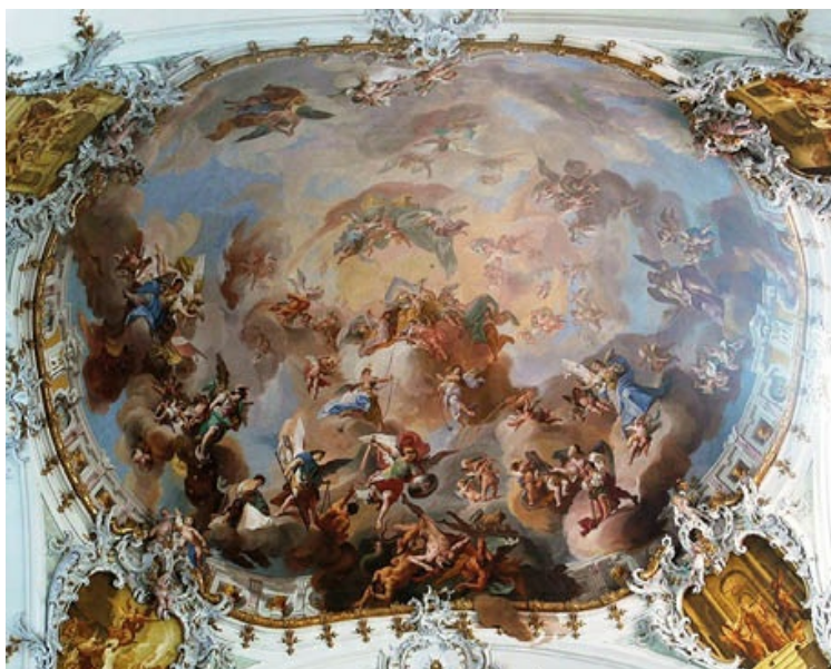
Fischer remodeló la abadía de Ottobeuren, «El Escorial de Suabia», cuya cúpula exulta decoración policroma en oro y tonos claros con perspectivas en trompe l'oeil .