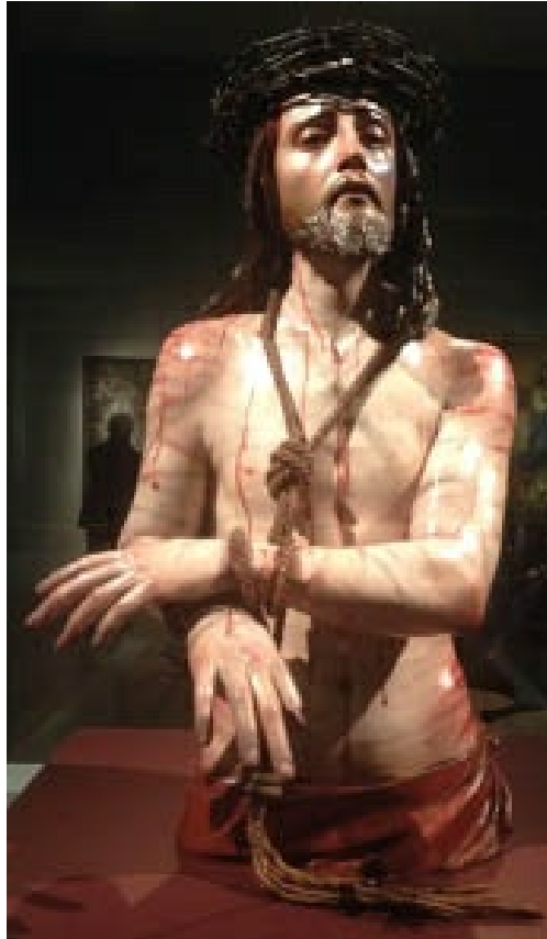
Ecce Homo , por Pedro de Mena, talla que muestra la tendencia de este escultor hacia un notable patetismo espiritual, no exento de un gran naturalismo.

Pedro de Mena (1628-1688) fue hijo del también escultor Alonso de Mena, por lo que inició su trabajo en el taller paterno. En 1658 se trasladó a Málaga, donde se encargó de la sillería de coro de la catedral, donde los relieves rompen el marco arquitectónico.