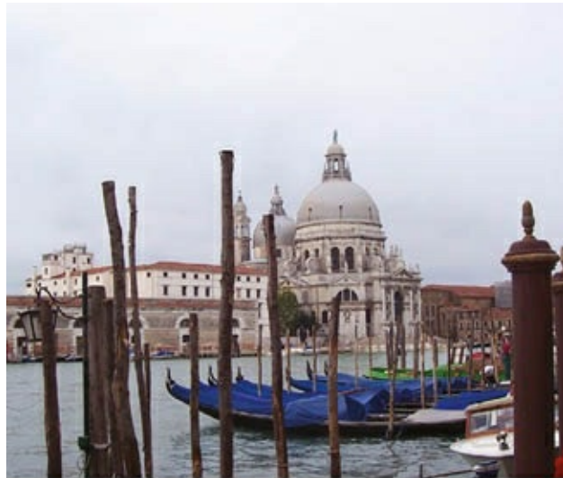
Baldassare Longhena. Basílica de Santa María de la Salud, situada a la entrada del Gran Canal. Destaca desde cualquier punto de Venecia su enorme cúpula apoyada sobre tambor octogonal.

Su principal obra fue la basílica de Santa María della Salute (Santa María de la Salud), para cuya construcción, en 1652, hubo de ganar un concurso que se convocó con el objeto de realizar con este templo una ofrenda a la Virgen, en acción de gracias por la desaparición de una epidemia de peste que asolaba la ciudad.