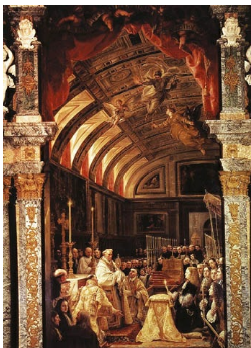
Adoración de la Sagrada Forma por Carlos II de Claudio Coello (1685-1690), en la sacristía de El Escorial. Toda una galería de retratos y una muestra de preciosismo en los ropajes, con una perspectiva efectista que prolonga el escenario real.

Domina las técnicas efectistas y teatrales, la perspectiva y los recursos ilusionistas. En los retratos de corte muestra un detallismo minucioso — herencia flamenca— y una técnica que destaca las figuras sobre fondo oscuro o neutro imprimiéndolas una gran elegancia. Posee un dibujo preciso y un perfecto tratamiento del espacio, donde hace gala de una gran escenografía, como se observa en la Adoración de la Sagrada Forma por Carlos II , en la sacristía de El Escorial, comenzada por su maestro; constituye una galería de retratos y una muestra de preciosismo en los ropajes. En La Sagrada Familia con san Luis , del Museo del Prado, recuerda los modelos de sacra conversazione italianos.