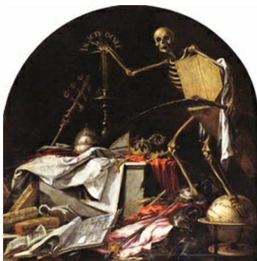
In ictu oculi [ 'En un abrir y cerrar de ojos' (1 Corintios 15:52)] de Valdés Leal (h. 1671) en el Hospital de la Caridad de Sevilla. La barroca teatralidad macabra se manifiesta en esta obra de vanitas .

Alonso Cano se trasladó a los trece años desde su Granada natal a Sevilla y entró como aprendiz en el taller de Francisco Pacheco, donde trabó amistad con Velázquez. Se cree que debió estudiar también con el escultor Martínez Montañés. En 1638 marcha a Madrid, entra como pintor de cámara del conde-duque de Olivares y vuelve a coincidir con Velázquez. Muere su segunda esposa (1644) y, acusado por la justicia como autor del asesinato, marcha a Valencia, aunque no llegó a probarse totalmente su responsabilidad y fue declarado inocente.