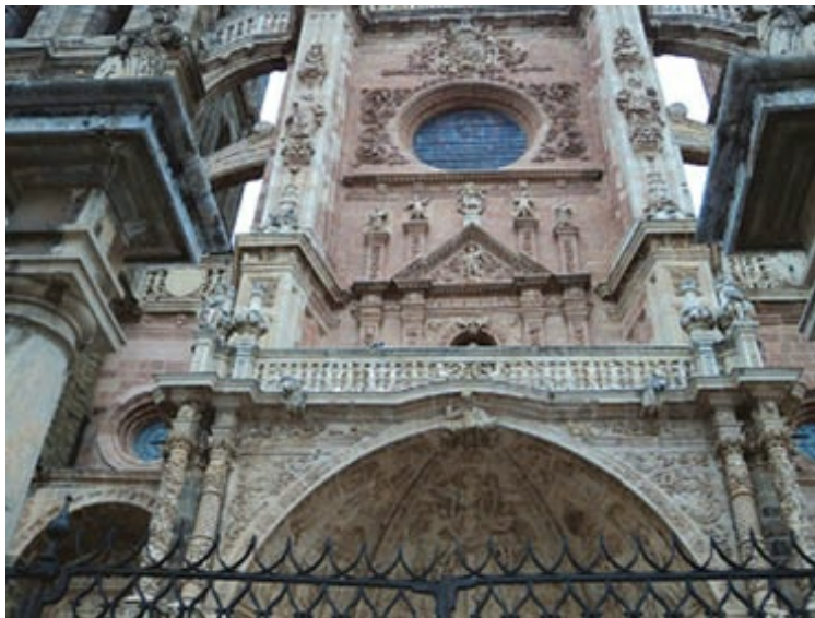
Detalle de la fachada principal de la catedral de Astorga. Columnas abalaustradas, con decoración profusa, recorren el hastial central, que muestra como si fueran sus entrañas, al igual que la Pulchra leonina , los arbotantes que la soportan.

XIX, por una peineta entre dos columnas como las citadas, calada con una roseta y terminada en frontón con volutas y tres ornamentados pináculos. La portada central destaca bajo un pórtico adelantado al plano en forma de exedra —inspirado, según E. Morais, en Santa María de Viana, Navarra— coronada a modo de retablo por un cascarón decorado con el relieve del Descendimiento flanqueado por la Expulsión de los mercaderes y la Mujer adúltera ; la puerta de entrada se abre bajo arco polilobulado. Una ornamentación exuberante de raíz plateresca a base de putti , hojarasca carnosas, grutescos, como en horror vacui , cubre la superficie.