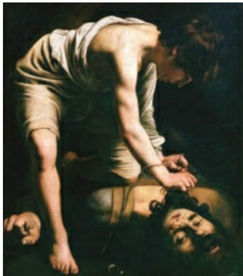
David vencedor de Goliath de Caravaggio (h. 1600), expuesto en el Museo del Prado. La luz tenebrista acentúa el contraste entre las zonas claras e iluminadas, intensificando el dramatismo de la escena.