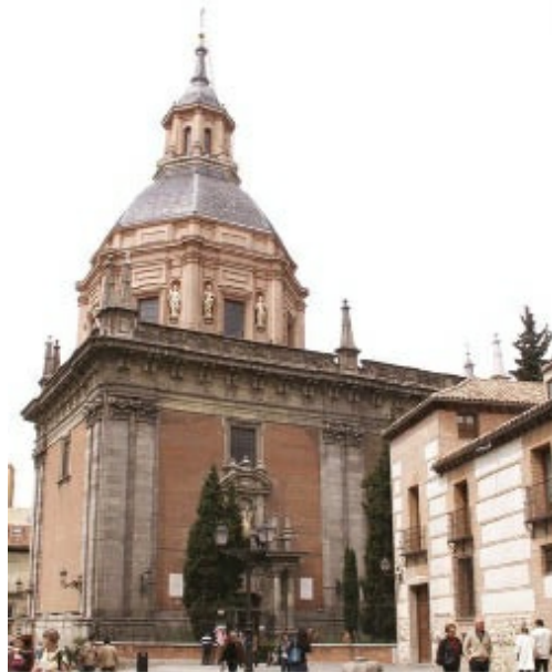
Capilla de San Isidro en la iglesia de San Andrés. De Pedro de la Torre. De planta cúbica, perpendicular a la cabecera, una enorme cúpula encamonada se alza sobre el elevado tambor.

En Toledo construyó para su orden la iglesia de San Ildefonso, de amplia nave de cuatro tramos y capillas a ambos lados, crucero poco marcado y cubierto con cúpula. En la fachada empleó el orden gigante de capitel corintio, los frontones curvos y el adorno con estatuas en hornacinas y relieves, rompiendo con el resto de construcciones toledanas.