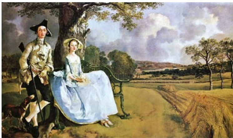
Los Andrews de Thomas Gainsborough (1750), en la National Gallery de Londres. Las figuras están ambientadas en el verde campo bajo nubes rompiendo.

Sir Joshua Reynolds (1723-1792) se caracteriza por un aire elegante y aristocrático, además de dominar también el tratamiento del paisaje. Pintó retratos de personajes importantes de su época, como el del Duque de Devonshire o el de Lord Heathfield . En el estilo elegante sigue a Van Dyck y exhibe una gran viveza de colorido.