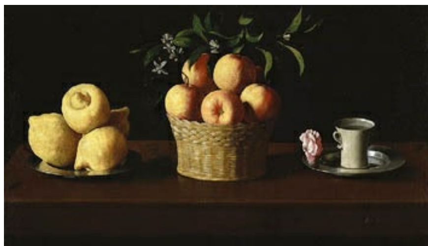
Naturaleza muerta con limones, naranjas y rosa de Francisco de Zurbarán (1633), en el Museo Norton Simon (Pasadena, Estados Unidos). El fondo neutro del bodegón permite la fuerza plástica de los objetos en distintas perspectivas resaltados por la luz.

Esta será la línea que seguirá el pintor a lo largo de toda su vida, a pesar de que los gustos, en el último tercio de siglo, iban sufriendo cambios y su estilo, fuertemente naturalista, pedía una evolución similar, por ejemplo, al caso de Velázquez. Careció de la celebridad oficialista como otros —incluso le sacudirán las dificultades económicas en los últimos años de su vida—, pero, sin duda, fue uno de los grandes pintores del Barroco: Milagro de San Hugo, Santa Casilda, P. Gonzalo Illescas, Virgen Niña dormida, Virgen de las Cuevas, Apoteosis de Santo Tomás, Cardenal Cartujo, Defensa de Cádiz , etcétera.