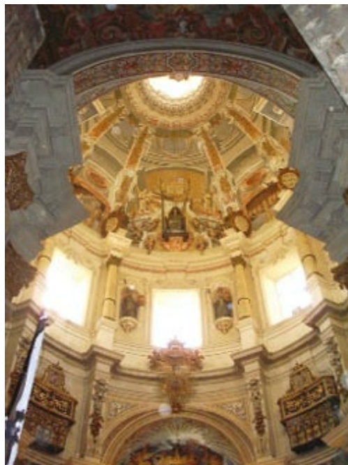
Leonardo Figueroa. Vista interior de la luminosa cúpula hemisférica sobre tambor circular de la iglesia de San Luis de los Franceses de Sevilla.

En Sevilla, Leonardo Figueroa (h. 1650-1730) continuó a partir de 1687 las obras del hospital de los Venerables Sacerdotes, y remató también la fachada de la iglesia del de la Caridad. Trabajó después en la remodelación de los templos de la Magdalena y de El Salvador y realizó la portada del palacio de San Telmo. Rayando el fin de siglo, inició su obra maestra, la iglesia de San Luis de los Franceses, inspirada en la planta de las Comendadoras de Santiago de Madrid, pero con elegante fachada-retablo de dos pisos, en la que alterna el juego cromático del ladrillo y la piedra. Columnas salomónicas enmarcan la ventana central en el segundo cuerpo y dos torres octogonales flanquean el conjunto. En planta de cruz griega, una luminosa cúpula semiesférica sobre tambor circular en el que se abren ocho ventanas se alza sobre el crucero.