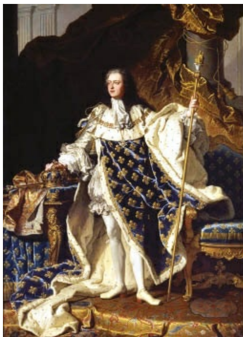
Luis XV retratado por Rigaud en 1730. Palacio de Versalles. Uno de los monarcas europeos que pusieron en práctica la política del sistema de gobierno conocido como Despotismo Ilustrado.

Los principales déspotas ilustrados fueron Federico II de Prusia, Carlos III de España, José I de Portugal, María Teresa y José II de Austria, Luis XV de Francia y Catalina II de Rusia.