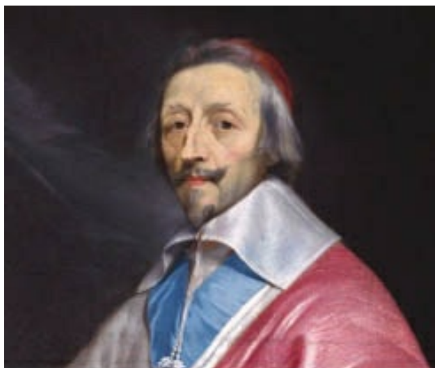
Retrato del cardenal Richelieu, 1635-1640, por Philippe de Champaigne (Museo del Louvre). La elegancia del retratado, primer ministro de Luis XIII, recuerda la pintura de Van Dyck.

Durante la minoría de edad de Luis XIV (1643-1715), se hizo cargo de la regencia su madre, Ana de Austria, y nombró primer ministro al cardenal Mazarino. Este —al igual que había hecho en la dirección del gobierno su antecesor, Richelieu— tuvo como objetivo de la política francesa, en el ámbito interno, fortalecer la autoridad real, dominar a la alta nobleza y hacer efectivo el control sobre todo el reino, a la vez que se aumentaba la recaudación de impuestos y se reforzaba el ejército, sobre todo, la Armada.