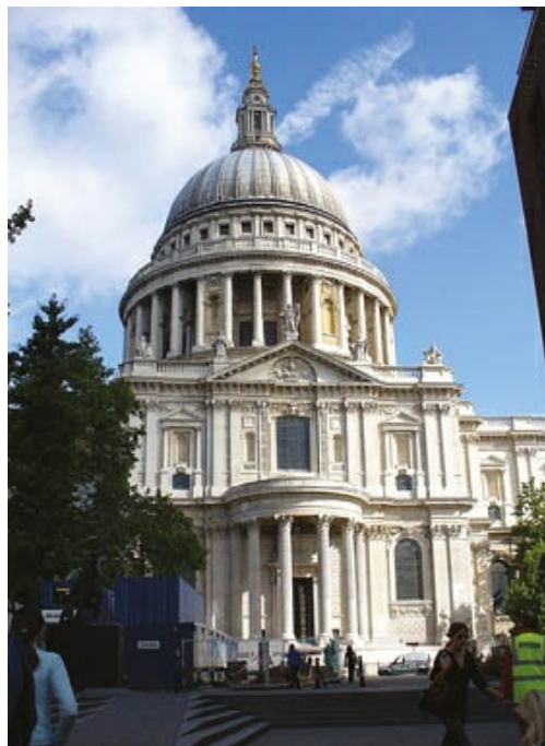
Christopher Wren. Catedral de San Pablo. Fachada sur del crucero, inspirada en Santa María della Pace de Roma por su diseño semicircular convexo que sobresale hacia el exterior.

Colaborador de Íñigo Jones fue Isaac de Caus (1590-1648). Conjuntamente construyeron la Wilton House (casa de Wilton, 1632), en cuyo interior destacan las lujosísimas salas del Cubo y del Doble Cubo, así llamadas por la estructura de su planta.