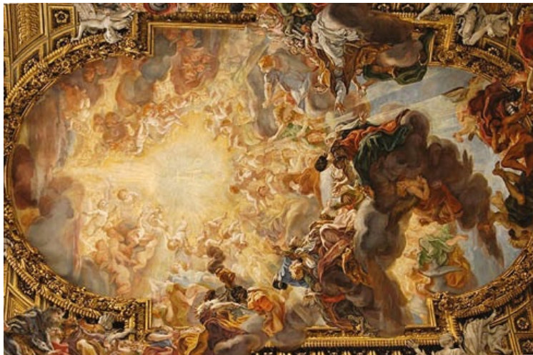
Triunfo del nombre de Jesús , de El accio (1672-1685) pintado sobre la bóveda de la iglesia de el Jesús (Roma). Los efectos ópticos de la perspectiva ilusionista en trompe l'oeil contribuyen a la fusión de arquitectura, pintura y escultura en artes decorativas.

Destacó también por sus composiciones al fresco en la decoración de techos, que abrieron las puertas al Barroco decorativo, como La Aurora del Casino Ludovisi, pintada en perspectiva de sotto in su .