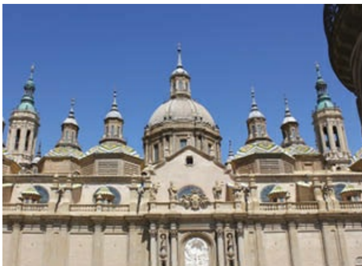
Vista parcial de El Pilar de Zaragoza, reformado por Ventura Rodríguez tras las primeras trazas de Herrera el Mozo. Destaca la cúpula semiesférica. Al fondo, dos de las cuatro torres.

En Galicia el principal representante de la arquitectura barroca fue Fernando Casas Novoa (c. 1670-1750). Se inició en el claustro de la catedral de Lugo bajo la batuta de fray Gabriel de las Casas. Posteriormente, realizó el convento de las Capuchinas en La Coruña y el de Belma en Santiago. En 1711 fue designado maestro de obras en la catedral compostelana, donde continuó los trabajos de Andrade en la capilla del Pilar. Su obra cumbre fue la monumental fachada del Obradoiro (1738-1749), con su concepción vertical y ascensional mediante órdenes de columnas superpuestos y el escalonamiento de las torres, junto con una profusa decoración geométrica — que en sus filigranas recuerda las obras de orfebres, de ahí el nombre: Obradoiro—, consiguen, a la vez, proteger el Pórtico de la Gloria —esta fue la principal finalidad de la construcción— y proporcionar iluminación a la nave a través de las grandes cristaleras, lo que provoca el asombro del peregrino.