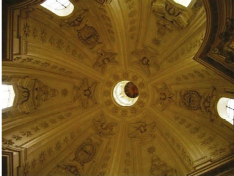
Francesco Borromini. Interior de la innovadora cúpula de la iglesia de San Ivo alla Santa Sapienza en Roma, con forma de hexágono estrellado de perfil mixtilíneo para adaptarse a la planta del edificio.

(Suma Sabiduría) y la estrella del pontífice. Remata la obra sobre la linterna una espiral o zigurat de inspiración oriental, como la planta del edificio, que representa la torre de Babel. En la cúspide dispuso una cruz sobre una esfera, que simbolizaba el brillo sobre todo el mundo.