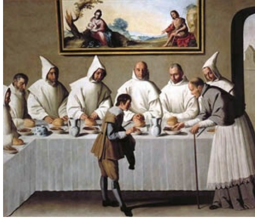
Milagro de san Hugo en el refectorio , de Zurbarán (1655) en el Museo de Bellas Artes de Sevilla. La carne se convierte en ceniza indicando austeridad. Las figuras arqueadas, la perspectiva de la mesa, denotan el dominio geométrico de la composición.