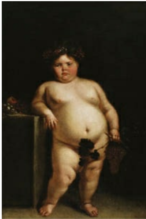
La monstra desnuda (h. 1680), en el Museo del Prado. Personificando a Baco, Carreño de Miranda retrató por orden de Carlos II a esta niña-bufona, que padecía una enfermedad genética.

Tomado bajo la batuta y protección de Velázquez, evolucionó rápidamente hacia una composición plenamente barroca —utilización de la luz, aparato teatral y escénico de las figuras—, al tiempo que recibe diversos encargos para lugares importantes, como la decoración al fresco del Salón de los Espejos del Alcázar de Madrid (1659).