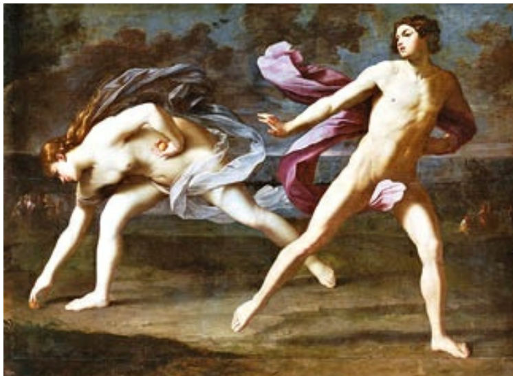
Hipómenes y Atalanta de Guido Reni 1625), en el Museo del Prado. Cautivada por las manzanas de oro que el primero dejó caer, la atleta pierde la carrera. Gestos dispares, dinamismo, perfección formal: el Barroco académico clasicista.