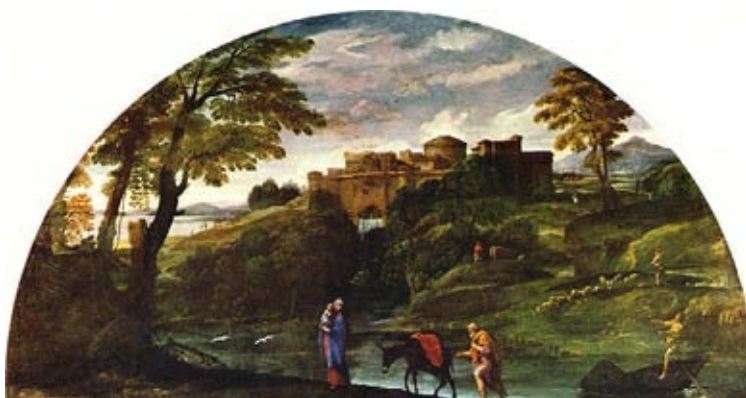
Huida a Egipto de Aníbal Carracci (h. 604), en la Galería Doria (Roma). Las arquitecturas clasicistas que incluye la composición crean un paisaje bucólico que inspira, como el tema, melancolía.

Francesco Albane o Albani (1578-1660), que fue discípulo de los Carracci y trabajó también con Guido Reni. Practicó una pintura de corte academicista pleno y trató el tema mitológico, especialmente. En sus cuadros el paisaje cobra especial relevancia, siendo las figuras un mero acompañamiento de la escena. Tiende hacia la temática galante e incluso frívola, dirigida a la nobleza y a la alta burguesía, quienes le hacen numerosos encargos.