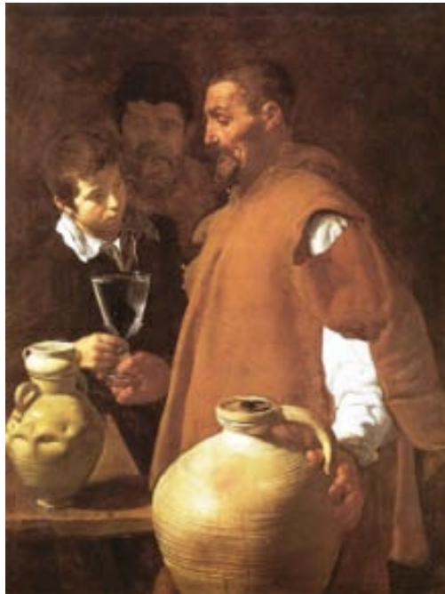
El aguador de Sevilla de Velázquez (1622) en el Wellington Museum (Londres). El realismo campa en la copa, las gotas de agua, los tipos populares y el probable autorretrato del joven genio bajo la luz contrastada. La figura desenfocada del segundo plano denota su temprano interés por los efectos visuales.