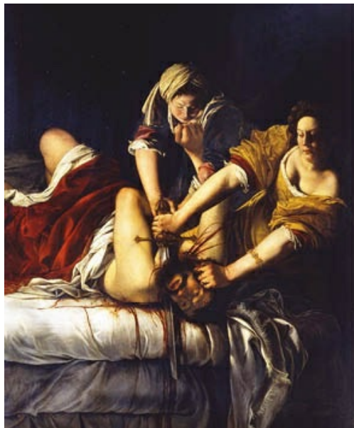
Judit cortando la cabeza a Holofernes , de Artemisa Gentilleschi (h. 1613), en la galería Uffizi, (Florencia).El claroscuro de corte caravaggiesco acentúa el dramatismo de la acción, en la que

Su hija, Artemisa Gentilleschi (1593-1653), la primera mujer que logró entrar en la Academia de Bellas Artes de Florencia, fue una artista de gran talento, que se inició en el taller de su padre. Después de haber sido víctima de una violación por parte de un colega, trauma que arrastró toda su vida porque además sufrió un proceso nada fácil para lograr solo una liviana condena del agresor, decidió realizar una pintura en la que las protagonistas fueran mujeres que habían mantenido una actitud heroica o resistente en episodios bíblicos, como Judit cortando la cabeza a Holofernes —cuadro en el que se autorretrata como protagonista de la acción— o Susana y los viejos , que rememora a una joven hebrea que tras sufrir el acoso de dos ancianos aún estuvo a punto de ser condenada por lasciva si no hubiese sido por la intervención a su favor del profeta Daniel.