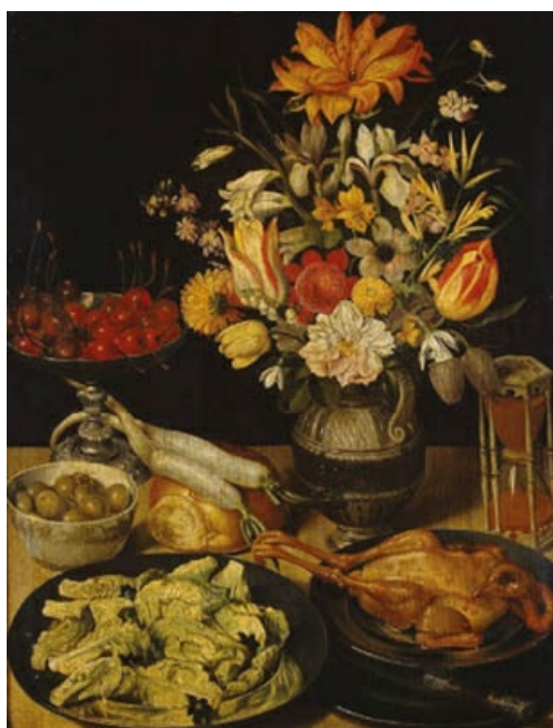
Georg Flegel. Naturaleza muerta con flores y aperitivos , h. 1635. Museo del Ermitage (Leningrado). Uno de los numerosos temas de bodegón que pintó este artista.

En el género de los bodegones o naturaleza muerta el principal representante de la pintura alemana fue Georg Flegel (1566-1638): Armario con flores, frutas y copas o Naturaleza muerta con flores y aperitivos , entre otras muchas.