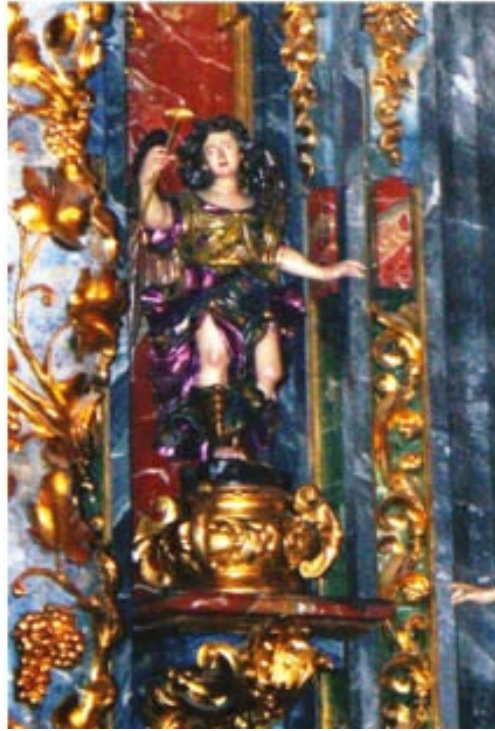
Ángel pasionario , talla policromada atribuida a Luisa Roldán, la Roldana, en el retablo de la capilla del Cristo de la colegiata de San Isidro de Madrid. La gracia rococó asoma en esta escultura.

Pedro Roldán (1624-1700) fue discípulo de Pedro de Mena en Granada. Aportó realismo patético a la imaginería barroca andaluza, si bien menos crudo y dramático que el de la escuela castellana. Tuvo un gran taller. Fue profesor de Dibujo en la Academia de Sevilla, que fundó Murillo en 1660. En los relieves supo utilizar el paisaje y los fondos en perspectivas logradas mientras los numerosos personajes que componen la escena se hallan sabiamente distribuidos, como en el retablo del hospital de la Caridad y en el de la capilla de los Vizcaínos de la catedral, logrando con ello llegar al culmen de la teatralidad barroca.