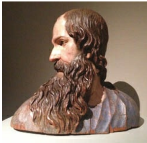
Cabeza de san Pablo de Alonso Cano, en la Catedral de Granada. La perfección técnica se observa en la ejecución formal de la obra.

En Alonso Cano (1601-1667), escultor, ya en su época sevillana inicial se aprecia la huella notable de Martínez Montañés, con quien tuvo una etapa de aprendizaje. Alcanzó inmediatamente renombre en la realización de retablos, como el mayor de Santa María de la Oliva de Lebrija (1631) o el de San Juan Evangelista de la iglesia de Santa Paula (1637). En el primero, híbrido de pintura y escultura, presidido por la clasicista Virgen de la Oliva y rematado con el Crucificado en el ático, rompe la estructura en calles y pisos empleando el orden corintio colosal, lo que repite en el segundo, que contiene las esculturas del santo, querubines y guirnaldas.