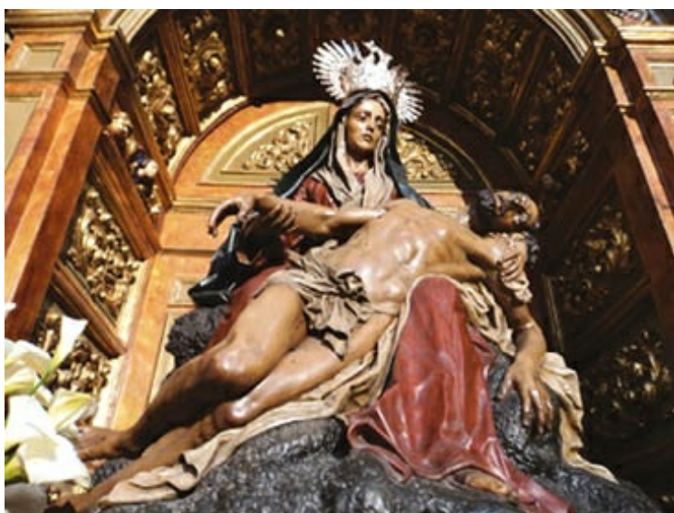
Piedad , por Luis Salvador Carmona, en la iglesia de San Martín de León. Destaca el fino estudio anatómico del estilizado cuerpo de Cristo desplomado.