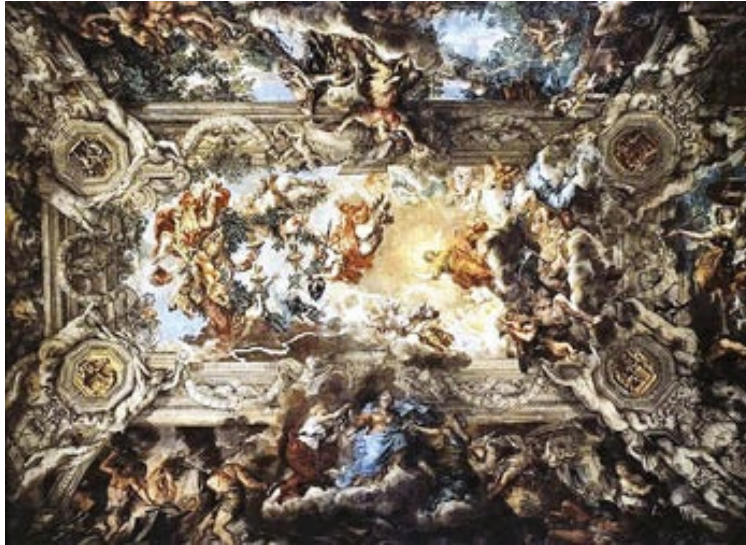
Triunfo de la Divina Providencia de Pietro da Cortona (h. 1632-1639), en el palacio Barberini (Roma). Fundiendo colorido y movimiento hace flotar a las figuras en el espacio desde una perspectiva de sotto in su .