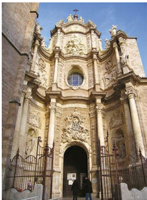
Fachada principal o de los Ferros de la catedral de Valencia, diseñada en juego cóncavo convexo, comenzada por Rodolfo y terminada por los Vergara.

En Levante destacan dos obras principales, que realizaron otros tantos artistas.