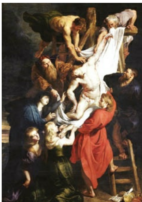
Descendimiento de Rubens (1611). Parte central del tríptico de la catedral de Amberes. La pintura barroca en estado puro: diagonal compositiva, fuertes escorzos, dinamismo, teatralidad, colorido exuberante.

Entre 1622-1625 pinta, para la galería de Luxemburgo en París, las veintiuna grandes composiciones de la Historia de María de Médicis , a quien realiza también un elegante retrato, que como todos los que lleva a cabo el pintor es aparatoso y solemne para dar una idea de la alta posición social del personaje.