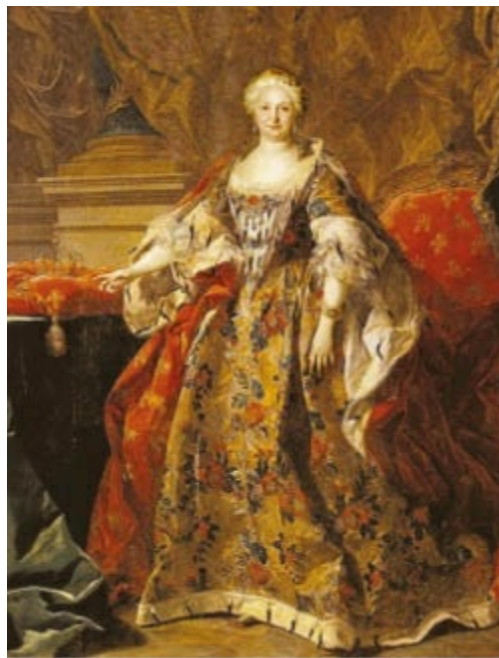
Retrato de Isabel de Farnesio, segunda esposa de Felipe V, por Van Loo, en la Granja de San Ildefonso, Segovia

Solo Luis XIV aceptó dicha disposición de última voluntad, las demás potencias europeas, temerosas de que se rompiese el equilibrio europeo a favor de Francia si el nuevo rey de España, Felipe V, heredaba también la Corona francesa, declararon nulo por incapacidad el testamento del rey Carlos II y firmaron la Gran Alianza de La Haya en apoyo del candidato Carlos de Austria. Una nueva guerra estaba servida en las tierras y en los mares de Europa y las colonias, la guerra de sucesión española (1700-1713).