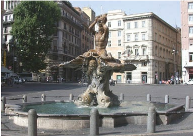
Fuente de Tritón esculpida por Bernini, situada en la plaza Barberini de Roma. Sentado sobre una gran concha sostenida por cuatro delfines que enredan la tiara pontificia, el dios marino lanza agua por una caracola.

Se relaciona con la obra anterior por su gran misticismo la imagen de La beata Ludovica Albertoni , en la iglesia de San Francesco a Ripa de Roma.