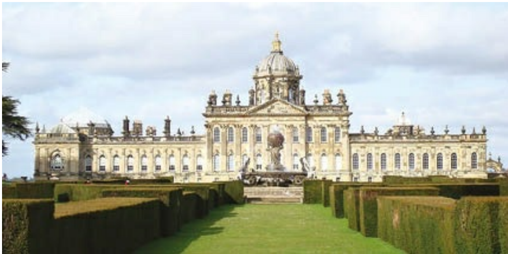
Castillo Howard. Edificio rectangular presidido por un pórtico clasicista sobre el que se impone una gran cúpula semiesférica con linterna sobre elevado tambor.

Ambos edificaron posteriormente el Castle Howard (castillo Howard) en North Yorkshire, edificio rectangular presidido por un pórtico clasicista con pilastras corintias adosadas y frontón triangular de remate, sobre el que se impone, bien visible desde el exterior, una gran cúpula semiesférica con linterna sobre elevado tambor, que cubre el vestíbulo de planta cuadrada, abierto al patio; un tipo de edificio de los llamados entre cour et jardin , es decir, construidos entre el jardín que le precede y el patio posterior. Su señorial interior, con grandes arcadas sostenidas por elevadísimas pilastras corintias adosadas, más se asemeja a un templo que a una residencia civil, salvando los bustos y estatuas que en exceso lo adornan. En el jardín se levantaron diversas construcciones imitando estilos antiguos, como templetos clásicos y obeliscos egipcios.