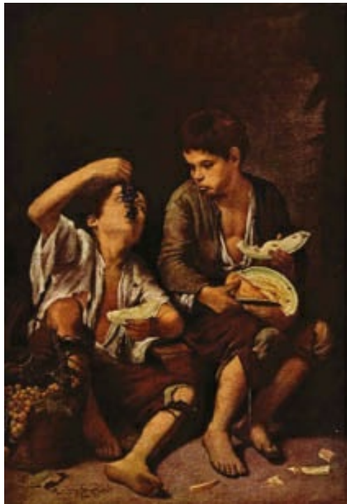
Niños comiendo melón y uvas (h. 1650). Pinacoteca de Múnich. La faceta picaresca del primer Murillo, a pesar de buscar la gracia en lo espontáneo de esta escena de género, no deja de ser una crítica a la situación social miserable.

Juan Valdés Leal (1622-1690) se formó en Córdoba, en el círculo de Antonio del Castillo. En 1656 se halla de nuevo en Sevilla y, en 1660, participa con Murillo en la fundación de la Academia. Su obra principal es Jeroglíficos de las postrimerías , que consta de dos títulos: In ictu oculi ('en un abrir y cerrar de ojos') y Finis gloriae mundi ('el fin de la gloria del mundo'), en la macabra temática de vanitas y el gusto por reflejar toda su crudeza: ataúdes abiertos mostrando despojos humanos junto a los placeres terrenales y el poder que nadie se lleva de este mundo, relacionable con el tratamiento de lo fantástico, una corriente que se alarga hasta Goya y la pintura surrealista.