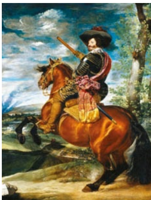
Retrato ecuestre en corveta del conde-duque de Olivares, valido de Felipe IV, pintado por Velázquez (h. 1638), en el Museo del Prado. Su política centralista fraguó el caldo de cultivo de las sublevaciones internas, cuyo año crítico fue 1640.

Pero como era previsible, la reacción no tardó en aparecer. Ya en 1630, dentro de la propia Corona castellana, concretamente en Vascongadas y Navarra —que gozaban de cierta autonomía—, la cuestión de las levas había ocasionado disturbios en Guernica y Bilbao.