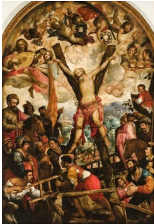
En el Martirio de san Andrés (h. 1610, Museo de Bellas Artes de Sevilla), Juan de las Roelas introduce los dos mundos: terrenal y celeste con rompimiento de gloria, algo típico de su pintura.

Francisco Pacheco (1564-1654), suegro de Velázquez y también su maestro artístico durante los años de aprendizaje en Sevilla antes de la llegada a la corte del joven pintor, destacó por su aportación a la técnica del retrato y por la introducción de aspectos realistas. Tuvo también importancia como teórico por su tratado El Arte de la Pintura (1649), donde se ocupa de la elaboración de los temas religiosos.