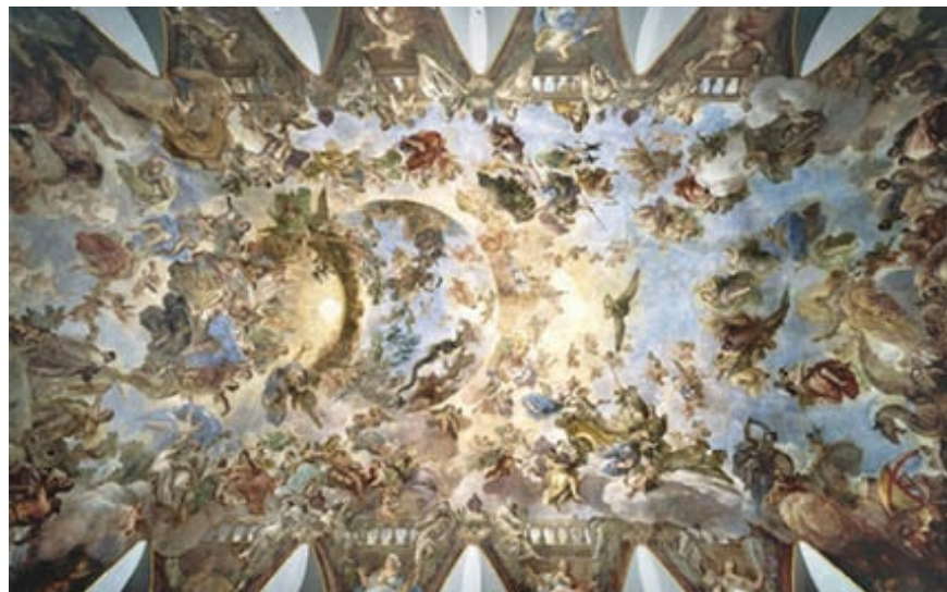
Alegoría del toisón de oro de Lucas Jordán, en la bóveda del Salón de Baile del Casón del Buen Retiro

Giambattista Tiepólo (1696-1770) destacó en la decoración de interiores: bóvedas, cúpulas; donde emplea todos los recursos ilusionistas de perspectiva y efectos ópticos, que conjuga con la representación de arquitecturas contemporáneas. Muestra influencias de su maestro, Piazzetta, y, sobre todo, del Veronés.