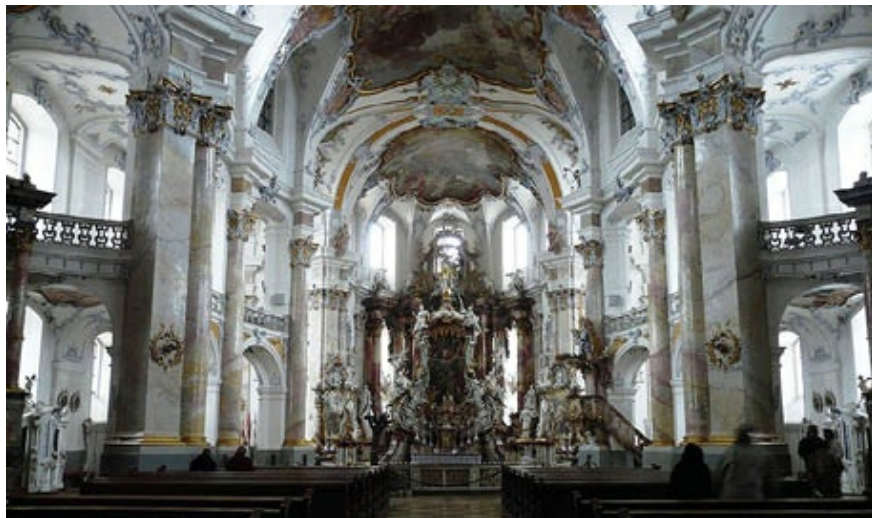
Johann Baltasar Neumann situó el altar en el centro de la iglesia de Vierzehnheiligen o de los Catorce Santos Intercesores (Alta Franconia). Tres óvalos de distinto tamaño en la nave y dos círculos en el crucero forman la original planta.