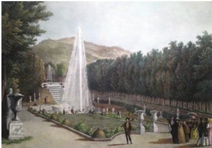
Cascada Nueva y parterre grande del palacio de La Granja (1821), según grabado del pintor italiano Fernando Brambilla, Palacio Real de Aranjuez, Madrid.

Ambos ampliaron el edificio con plantas de tres alas, dando lugar al patio de la Herradura —así llamado por su forma cóncava—, al suroeste, y al de los Coches al noroeste, con lo que se incorporaron dos cours d'honneur .