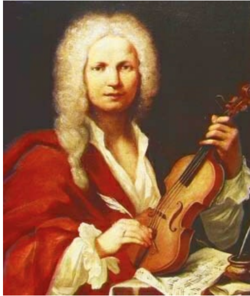
Retrato de Antonio Vivaldi de autor anónimo en 1723, en el Museo Internacional y Biblioteca de la Música de Bolonia (Italia)

En la música vocal se dieron la ópera, el oratorio, la cantata y el motete. En la música instrumental las formas fueron preludios, tocatas, fantasías y fugas, junto a la sonata, la suite , el concierto y la fuga.