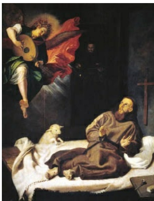
San Francisco confortado por un ángel músico de Francisco Ribalta (h. 1620) en el Museo del Prado. Obra de la última época del pintor en la que se aprecia su naturalismo y expresividad.

Respecto a la formación artística de José de Ribera, llamado en Italia Lo Spagnoletto (1591-1652), se desconoce en gran parte. No se sabe si su estilo lo aprendió directamente en la corte o si se formó con los seguidores de El Escorial. Lo cierto es que, en 1615, se encontraba ya en Italia, estableciéndose, después de pasar por Roma y Parma, en Nápoles al correr el año 1616. También se dice que su formación fue netamente italiana, pero el hecho es que el estilo de Ribera es claramente individual, fruto de la reacción naturalista de su época frente al idealismo renacentista. Su obra es una lección constante de realismo.