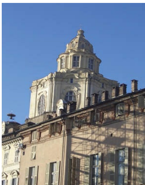
Guarino Guarini. Vista exterior de la iglesia de San Lorenzo de Turín, en la que se observa el octógono de lados cóncavos del que parte la cúpula formada por arcos planos entrecruzados.

La misma fuente musulmana le sirvió en la iglesia de San Lorenzo para levantar una cúpula de arcos planos entrecruzados que dejan libre su centro, observándose la influencia no solo de las bóvedas estrelladas y de nervios cruzados de la mezquita de Córdoba, que conoció en sus viajes por España, sino también de Borromini en la iglesia de San Ivo, con la variante de que si en esta se partía de un hexágono de lados alternos cóncavo convexos, Guarini lo hace de un octógono de lados cóncavos.