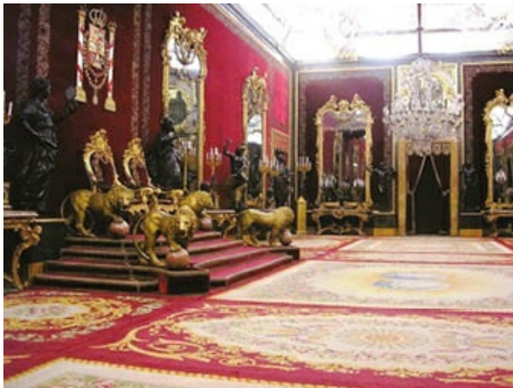
Salón del Trono del Palacio Real o de Oriente de Madrid. Cuatro leones de bronce dorado custodian a sus pies la sede de los monarcas, rodeados de espejos con marcos rococó, lámparas de araña, estatuas...

Edificado en piedra granítica de Guadarrama para los basamentos y muros lisos y piedra blanca de Colmenar en columnas, pilastras, etc.; su puerta principal da a la plaza de la Armería, por la que se accede a la gran escalera de mármol, obra de Sabatini, que consta de un tramo de subida y otro de bajada. Posteriormente, se accede a las distintas dependencias: alabarderos — cuerpo de guardia— salón de Columnas, estancias de Carlos III: saleta, antecámara y salón de Gasparini, en la que el rococó campa en la decoración: los estucos chinescos se desbordan en la bóveda, los mosaicos de mármoles de colores en el suelo, todo dirigido por el pintor y decorador italiano de quien toma el nombre. Sobre la chimenea, el reloj con autómatas vestidos a la moda de la época, que bailan cuando, al dar las horas, un pastor sentado toca la flauta. También sobre pavimento diseñado por el mismo artista, la Saleta de Porcelana, cuyas paredes y techo se hallan recubiertos por entero de este material sujeto a un armazón interior de madera, procedente de la Real Fábrica del Buen Retiro, al igual que en Aranjuez.