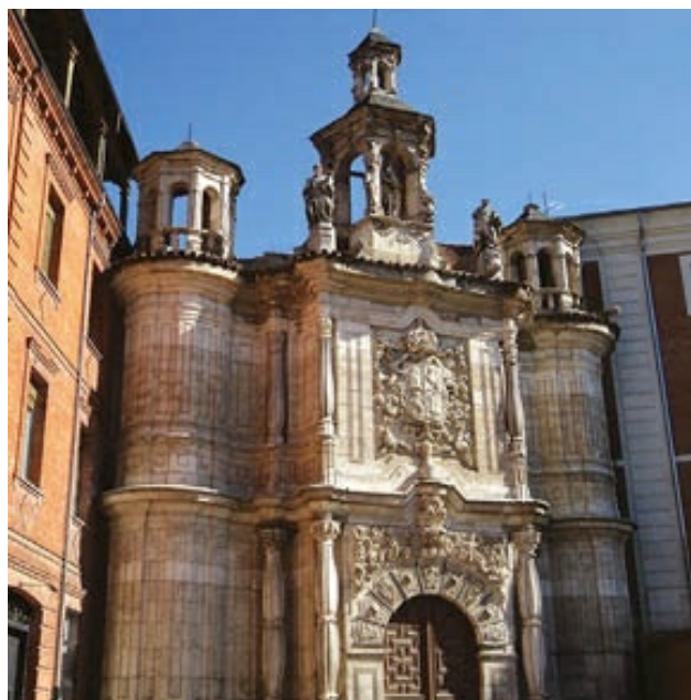
Fachada de la iglesia de San Juan de Letrán, «la obra más genuinamente barroca de Valladolid, por su movimiento, en forma ondulada, y por su jugosa ornamentación» (Martín González).

«La obra más genuinamente barroca de Valladolid, por su movimiento, en forma ondulada, y por su jugosa ornamentación», dice Martín González, es la fachada de la iglesia de San Juan de Letrán, terminada por Matías Machuca en 1739, con sus ocho columnas de fustes bulbosos, muestra del artificio de este estilo.