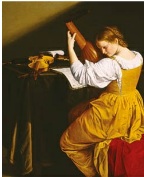
La tañedora de laúd de Orazio Gentilleschi (h. 1626), expuesto en la National Gallery of Art (Washington). Influenciado por las escenas de género de Caravaggio, destaca la luz que baña la escena y su poco frecuente vista de espaldas.

Caravaggio, de quien «es muy fácil comprobar si un lienzo es suyo [...] porque a diferencia de Leonardo o de Tiziano no tenía taller», según comenta Graham Dixon, dio vida a una corriente fundamental para el desarrollo de la pintura barroca: el tenebrismo, que influyó tanto en la pintura italiana como en otras partes de Europa, especialmente en España —escuela valenciana: Ribalta, Ribera; escuela andaluza: Zurbarán y primeras obras de Alonso Cano y Velázquez—, en Francia y Holanda. Sus fuertes contrastes lumínicos («luz de bodegón»), que resaltan aquellas zonas de la composición que más interesan, su realismo y su búsqueda de virtuosismos —que le contraponen a sus contemporáneos, los Carracci, quienes se dedican a la investigación en una línea ecléctica— crean un estilo particular que se extenderá bajo la denominación de caravaggismo o caravaggiesco.