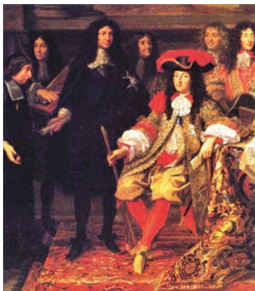
Jean-Baptiste Colbert, el súper ministro económico defensor del mercantilismo, presentando a los miembros de la Real Academia de Ciencias a Luis XIV, por Henri Testelin, 1667

A mayor abundamiento, para los mercantilistas, la cantidad de oro y plata que un país poseía se valoraba por la que tenían en su poder el resto de naciones. Así, un Estado era más rico o pobre en función de los demás, lo que condujo a una agresividad en las relaciones internacionales.