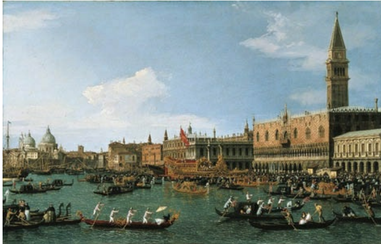
Retorno de il Bucintoro el día de la Ascensión (1729), expuesto en el Museo Nacional de Arte de Cataluña (Barcelona). Una de las muchas estampas de su ciudad que realizó el Canaletto.

A su regreso a Venecia continuó cultivando el género paisajístico y cobrará gran popularidad por sus bellas vistas del Gran Canal y las diversas estampas de la ciudad, que algunos consideran repetitivas.