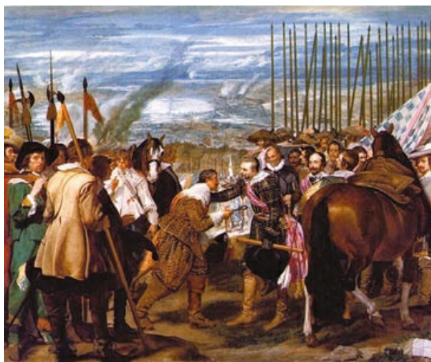
La rendición de Breda o Las Lanzas , por Velázquez de Velázquez (1634-1635), en el Museo del Prado. Cuadro que conmemora la rendición de esta plaza holandesa. Más correcto sería «las picas», que esas son las armas que sostienen los tercios.

Respecto a Holanda, extinguida en 1621 la Tregua de los Doce Años, se reanudaron las hostilidades. Los tercios de Ambrosio de Spínola lograron un éxito de renombre en la rendición de la plaza de Breda (1625), que puso fin a un asedio que dejó una catástrofe humana. El prestigio duraría hasta la derrota de Rocroi, en 1643.