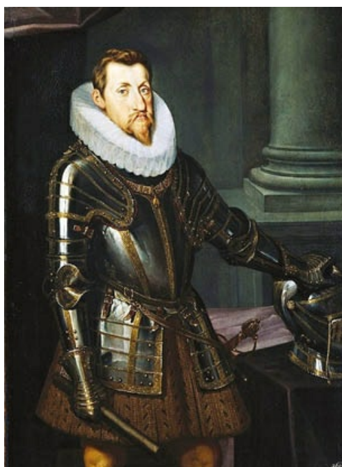
El káiser Fernando II de Habsburgo en 1614, por autor desconocido. Su pretensión de transformar la sucesión a la Corona, que era electiva, en hereditaria fue una de las causas de la guerra de los Treinta Años.

Algunos partidarios de la revuelta intentaron continuar la guerra, pero un nuevo ejército imperial, también a las órdenes de Tilly, con la colaboración de los tercios españoles de Ambrosio de Spínola, conquistó el Alto Palatinado y el Palatinado Electoral. El primero pasó directamente a manos de Maximiliano junto con la dignidad electoral del segundo.