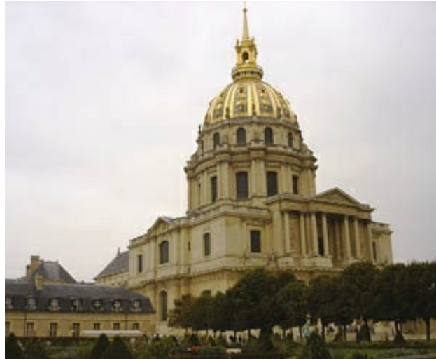
Jules Hardouin Mansart. Iglesia de Los Inválidos. Una apuntada aguja coronando la linterna remata la gigantesca cúpula dorada, visible desde casi todo París.

Para el palacio del Louvre se convocó un concurso con el fin de levantar una gran fachada que dignificase el viejo edificio, ya varias veces ampliado. Concurrieron al mismo varios arquitectos, entre ellos, Le Vau, Lemercier y Mansart, pero todos sus proyectos fueron sucesivamente rechazados. Entonces, Colbert llamó al afamado Bernini, pero su diseño no fue aceptado por parecer poco representativo del absolutismo monárquico.