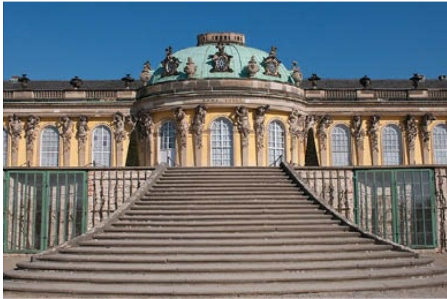
Detalle del cuerpo principal cubierto con cúpula, en la fachada norte del palacio de Federico II en Sanssouci, obra de Von Knobelsdorff con algunos diseños del monarca.

contaba con terrazas artificiales y numerosos templetos y pabellones a lo largo del jardín que le rodea, así como toda suerte de figuras mitológicas (atlantes, sátiros, ninfas) campando por las fachadas, mientras en la sala oval retorna la Antigüedad en la linterna acristalada que corona la gran cúpula, recordando el óculo abierto en la del panteón de Roma.