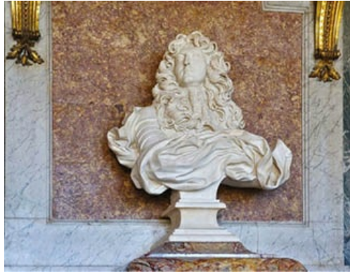
Busto de Luis XIV, obra de Bernini expuesta en el salón Diana del Palacio de Versalles. El máximo exponente del absolutismo monárquico.

obediencia aunque cometa abusos en el poder. Bossuet defendió la igualdad entre todos los hombres, pero afirmaba que la única manera de garantizar la paz y la seguridad era el sometimiento a un soberano, depositario de todo el derecho natural de los gobernados. Estos conceptos se mantuvieron hasta la llegada de la Revolución francesa, que inauguró una nueva edad en la historia, la Contemporánea.