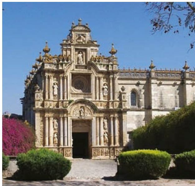
Cartuja de Jerez de la Frontera. Concebida como pétreo retablo, muestra dos órdenes superpuestos de columnas corintias pareadas que enmarcan hornacinas que albergan las imágenes. Un remate en dos pisos corona el edificio.