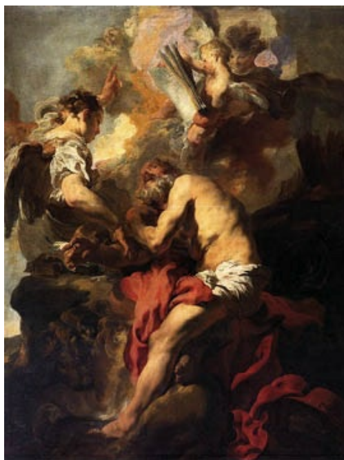
San Jerónimo y el ángel de Johann Liss (1627), en la iglesia de San Nicolás Tolentino de Venecia. Se observan influencias venecianas por su formación en Italia, aunque las tonalidades claras, pastel, preludian ya el estilo rococó.

Ese fue el caso de Adam Elsheimer (1578-1610), quien a pesar de no haber dispuesto de mucho tiempo en este mundo, aprovechó para formarse en la capital italiana tras una primera estancia en Venecia, donde adquirió las enseñanzas de los grandes maestros del Cinquecento como Tiziano, Tintoretto o Veronés, cuya influencia puede observarse en un Autorretrato o en las grandes masas boscosas que, en ambiente nocturno, ocupan la mayor parte de su cuadro sobre La huida a Egipto , realizado al óleo sobre cobre.