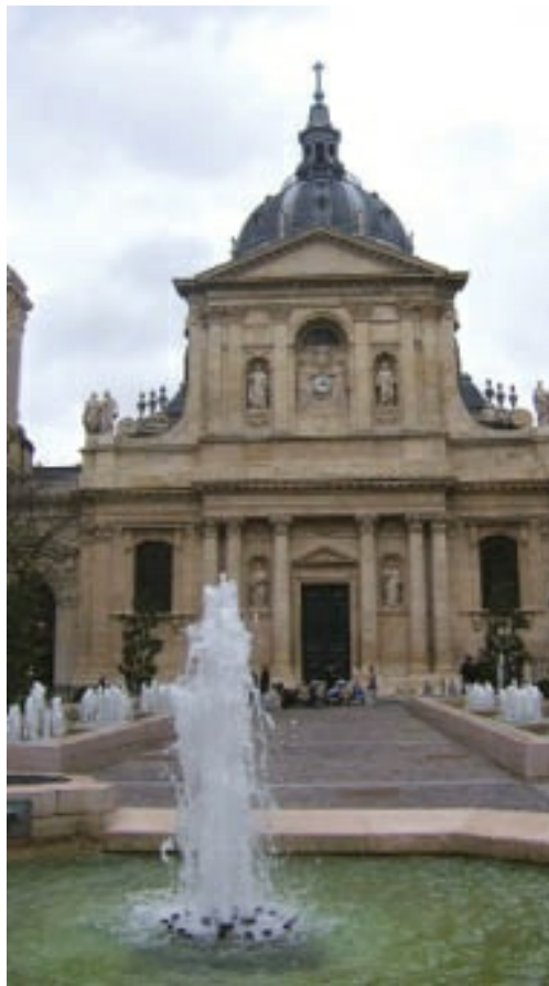
Fachada hacia la plaza de la iglesia de La Sorbona (París), obra de Jacques Lemercier. Una gran cúpula semiesférica gallonada sobre tambor octogonal elevado cubre el centro de su única nave rectangular.

Diez años más tarde, trabajó también en la cúpula de la iglesia votiva de Val-de-Grâce, que había iniciado François Mansart y concluirán, ya en 1710, Pierre Le Muet y Gabriel Le Duc. La fachada es puramente italiana, de inspiración jesuítica y raíces en Santa Susana de Roma y, en último término, en Santa María Novella de Florencia por los grandes alerones laterales que unen los dos cuerpos del edificio, salvando el pórtico sobresaliente adosado, formado por cuatro columnas corintias —dos a cada lado de la entrada— que sustentan un frontón triangular. Su planta es centralizada, rodeada por tres ábsides semicirculares que semejan un trébol.