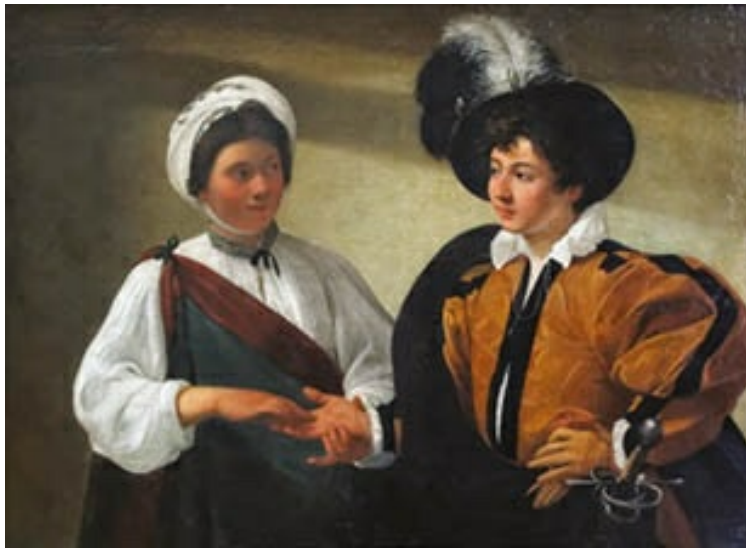
La buenaventura de Caravaggio (h. 1595, en la primera etapa del pintor), expuesto en el Museo del Louvre. Es en este tema de carácter popular —ajeno a los modelos idealizados— en el que comienza a manifestarse su característica luz dirigida.