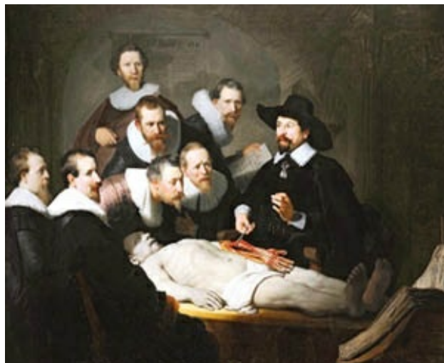
La lección de anatomía del doctor Tulp de Rembrandt (1632), en la Royal Picture Gallery Mauritshuis de La Haya. El primero de sus retratos en grupo, en el que plasma el gran interés por la ciencia que existía en su época.

De los dos últimos decenios de su vida —en los que emplea a menudo los colores rojo y oro— son El hombre del casco dorado, Joven en la ventana, Aristóteles, Titus leyendo, Amán, Esther y Asuero, Retrato de familia... , que muestran cierto aislamiento entre los personajes, plasmándose así el carácter propio de cada uno.