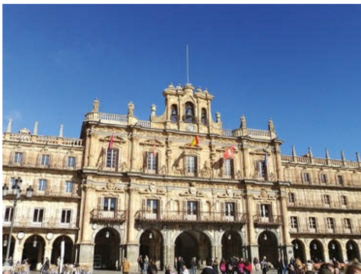
Plaza Mayor de Salamanca, terminada por García de Quiñones, autor también del edificio del ayuntamiento, en la foto.

Alberto, también hermano de los anteriores (1676-1750), realizó la sacristía y trazó la sillería de coro (1724) de la catedral nueva salmantina. Comenzó la plaza Mayor de esta ciudad (1728), que terminó en 1755 Andrés García de Quiñones (1709-1784) con el edificio de las Casas Consistoriales y su áulico programa iconográfico en los medallones de la fachada, al estilo de San Marcos de León, representando aquí reyes, militares, santos, sabios de la patria. En 1729 trazó el cuerpo superior de la fachada de la catedral de Valladolid, obra que había dejado inconclusa Juan de Herrera.