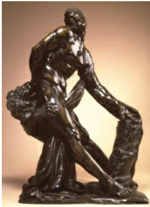
Réplica en bronce del Milón de Crotona , de Pierre Puget, realizada en 1688 a tamaño menor que el original de mármol. Las costuras en los muslos del envejecido atleta evidencian que la pieza fue fundida por piezas.

No obstante, hacia la mitad del siglo XVII, se desarrolló una escuela clasicista de la que fue buena muestra la fundación de la Academia (1648). En esta línea se inscribe François Girardon (1628-1715), que además de constituirse en uno de los principales representantes en Versalles del barroquismo galante, introdujo un gran naturalismo en alguna de sus obras, como Apolo servido por las ninfas (1668), en los jardines de palacio, que representa el aseo del dios tras su agotador viaje diario en el carro del sol. O la tumba en mármol del cardenal Richelieu (capilla de La Sorbona), cuyo cuerpo muerto sostiene sobre su última morada la alegoría de la Religión o la Doctrina, mientras le llora la de la Ciencia; su equilibrada composición fue diseñada en teatral contraposto por Charles Le Brun.