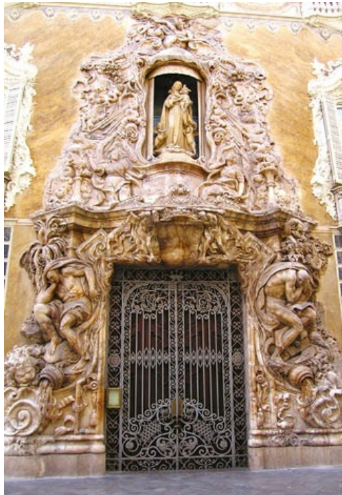
Ignacio Vergara el Joven. Portada del palacio del marqués de Dos Aguas en Valencia, cuyo río y el Júcar se hallan representados en cada uno de los dos atlantes que flanquean la entrada.

marquesado—, obra de Molinelli en el siglo siguiente para sustituir a la original en madera, dos atlantes que personifican a los dos ríos que entregan sus aguas a la región: el antes citado y el Júcar, bajo cuyos pies dos cántaros —aludiendo al título nobiliario de su propietario— derraman el líquido elemento.