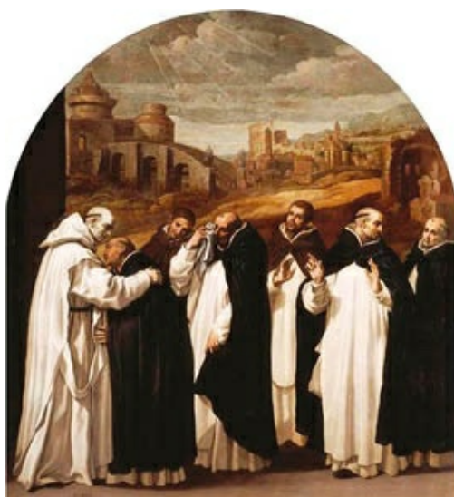
San Bruno se despide en Roma de sus compañeros , uno de los cincuenta y cuatro cuadros que pintó Vicente Carducho para el claustro de la Cartuja de El Pualar.

En su estilo se aprecia una ligera evolución hacia el Barroco al lado de reminiscencias de la época manierista.