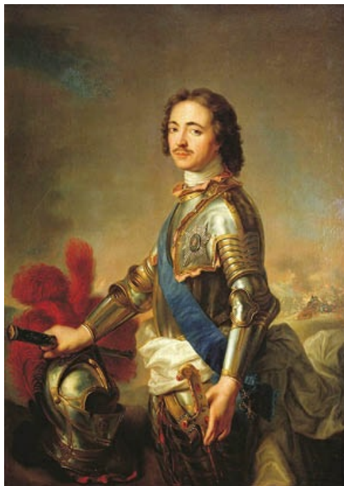
Pedro I de Rusia renunció al título de zar por el de Gossudar Imperator , príncipe emperador, para indicar que su poder había sobrepasado la órbita moscovita y se hallaba a nivel europeo.

Tras la ruptura de hostilidades por parte de Augusto II, una serie de victorias iniciales de las tropas suecas cuando estalló la inevitable guerra denominada del Norte, llevaron al trono polaco a un rey títere (Estanislao Leszczyński) al dictado de Suecia. No obstante, tras la derrota en la batalla de Poltava (1709) ante Rusia y la retirada de Carlos XII, herido, a Turquía, que se alargaría durante cuatro años, al final se terminó consiguiendo del sultán Ahmet III una declaración de guerra contra Pedro I, en 1711, y se reavivó el conflicto bélico con una serie de reveses rusos, cuyo ejército se hallaba aún en período de modernización.