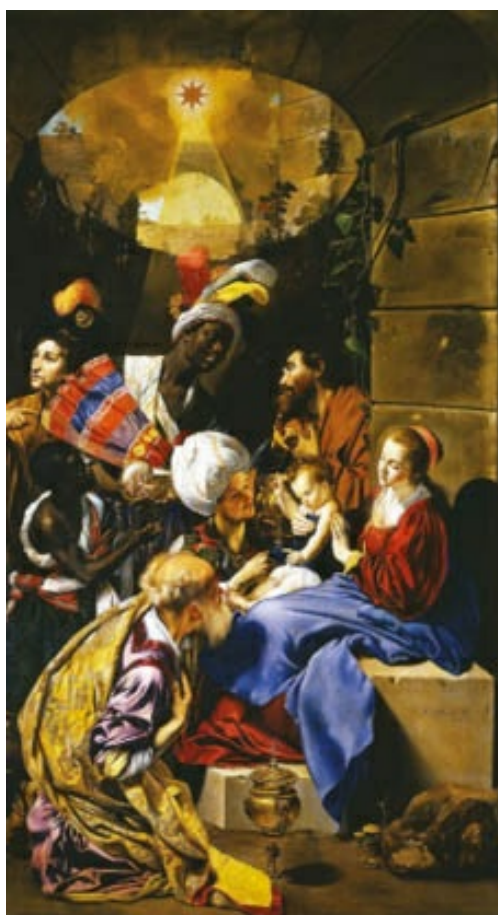
La Adoración de los Magos de Juan Bautista Maíno (1612-1614), en el Museo del Prado. El fino dibujo academicista y la iluminación contrastada, fruto de su etapa italiana, se observan en esta obra.

Fray Juan Bautista Maíno o Mayno (1581-1649) se formó desde muy joven en Italia. En 1611 volvió a España y en 1620, en Madrid, fue nombrado profesor de dibujo del futuro rey Felipe IV, lo cual le permitió el acceso a la corte, donde realizó diversos trabajos.